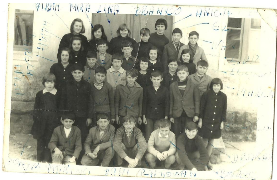
Slika 4. Kute 1/2 (Izvor: iz osobne kolekcije sudionika).

promjena na obrazovanje. Učenike se poučavalo likovnoj i glazbenoj kulturi, dok se tjelesni održavao na igralištu ili u školskom dvorištu. U višim razredima osnovne škole djeca su učila i strane jezike, primjerice francuski ili engleski, a kao posebnost onog vremena ističe se i nastavni predmet Domaćinstvo: Svi smo imali svoj nožić, nismo imali pilicu, nego nož, neku britvu ili koserić, i onda taj dan kad je rekla učiteljica da donesemo nešto za rezbarit, onda doneseš nešto, šta ja znam... I onda smo radili svašta. Onda smo učili radit ove... plesti košarice od bevke, znaš ono, žukva. To smo radili, i onda smo radili neke... neke ko vile ili one spone, znaš, za krave i to. (I.B.,69 - Kras). / I učili su nas kako se šiva, i kako se... Curice. A dečki su više radili drugo nešto. Kako se sa čekićima, sa ovo, sa ono... (M.S.,65 - Brest pod Učkom). Iako su učionice bile opremljene klupama, stolicama i školskom pločom, nije svaka škola imala osigurana i pomoćna sredstva kao što je primjerice zemljopisna karta, stoga je bio običaj posuđivati od obližnjih škola: (...) sjećan se da smo po pruge nosili po dvije... po dvoje nas da smo išli i nosili zemljopisnu kartu. (M.R.,73 - Vranja).