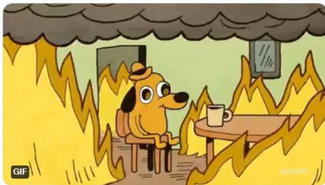
Primjer 5. iz banke se ne javlja niko.

iz banke se ne javlja niko. triban do 28.2. iselit iz stana ja: