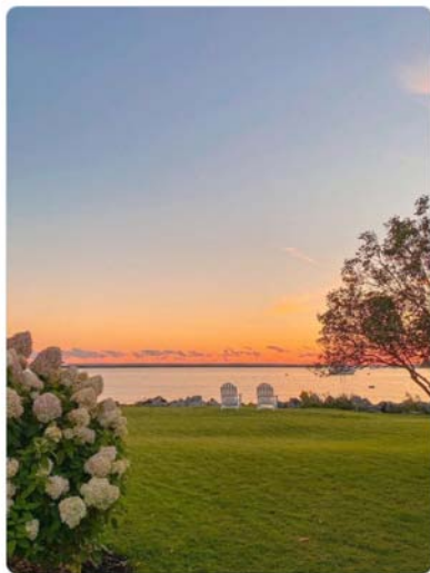
Primjer 1. Mentalno sam ovdje