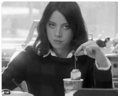
Primjer 6. Nezz, evo moja generacija...