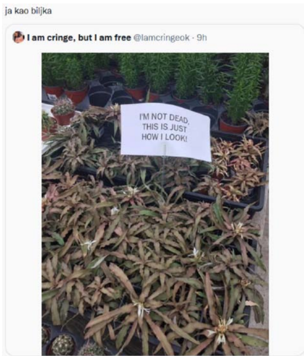
Primjer 3. ja kao biljka

od fotografije na kojoj su prikazane lončanice u vrtnom centru nad kojima se nalazi poruka I'M NOT DEAD, THIS IS JUST HOW I LOOK (NISAM MR-TVA, SAMO TAKO IZGLE DAM). Vjerojatno zbog specifičnog izgleda nije postojao velik interes kupaca za lončanice, zbog čega je prodavač stavio tu poruku. Autor je tvit s tom fotografijom izdvojio iz originalnog okruženja satiričnog Twitter računa (dekontekstualizacija) i potom ga smjestio u novo okruženje svojeg tvita, dodavši mu verbalni dio „ja kao biljka” (rekontekstualizacija). Verbalni je dio ostvaraj na Twitteru također ustaljene forme „ja kao [sadržaj slike]”, pri čemu autor tvita, slično kao i u prethodnim primjerima, želi podijeliti s pratiteljima svoje mentalno stanje, odnosno afektivno se pozicionirati i samoidentificirati. Razlika je u odnosu na prva dva primjera ta što se ovdje rabi osobni deiktik ja , što znači da autor pozicionira sebe kao fokus male priče. Ono što se sumarno postiže tiptom jest samoprijegorno i samokritično vrednovanje autora i to je iznimno učestala praksa samoidentifikacije i pozicioniranja na Twitteru.