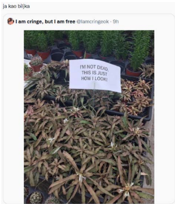
Primjer 3. ja kao biljka

od fotografije na kojoj su prikazane lončanice u vrtnom centru nad kojima se nalazi poruka I'M NOT DEAD, THIS IS JUST HOW I LOOK (NISAM MR-TVA, SAMO TAKO IZGLE DAM). Vjerojatno zbog specifičnog izgleda nije postojao velik interes kupaca za lončanice, zbog čega je prodavač stavio tu poruku. Autor je tvit s tom fotografijom izdvojio iz originalnog okruženja satiričnog Twitter računa (dekontekstualizacija) i potom ga smjestio u novo okruženje svojeg tvita, dodavši mu verbalni dio „ja kao biljka” (rekontekstualizacija). Verbalni je dio ostvaraj na Twitteru također ustaljene forme „ja kao [sadržaj slike]”, pri čemu autor tvita, slično kao i u prethodnim primjerima, želi podijeliti s pratiteljima svoje mentalno stanje, odnosno afektivno se pozicionirati i samoidentificirati. Razlika je u odnosu na prva dva primjera ta što se ovdje rabi osobni deiktik ja , što znači da autor pozicionira sebe kao fokus male priče. Ono što se sumarno postiže tiptom jest samoprijegorno i samokritično vrednovanje autora i to je iznimno učestala praksa samoidentifikacije i pozicioniranja na Twitteru.