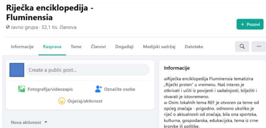
Slika 3. Facebook grupa Riječka enciklopedija – Fluminensia (REF)

Organizira se oko tema povezanih s gradom Rijekom i područjem riječkoga prstena, a fokus joj je na prošlosti i sadašnjosti toga područja. Članovi grupe su većinom osobe koje obitavaju na tome području, no u grupi participiraju i članovi koji s mnogih drugih osnova – obiteljskih, poslovnih, profesionalnih i inih – nalaze interes u riječkim temama. Zbog tenzija nastalih uglavnom po ideološkoj osnovi u danome trenutku dio je članova iz ove grupe istupio, što je rezultiralo nastankom nove grupe slična imena i slične koncepcije: Nova riječka enciklopedija – Fluminensia (NREF). Nova je grupa regulirana kao privatna mreža, što znači da samo članovi imaju pristup njezinu sadržaju, dok je ranija grupa bila i ostala regulirana kao javna, što znači da su sadržaji vidljivi svima na mreži.