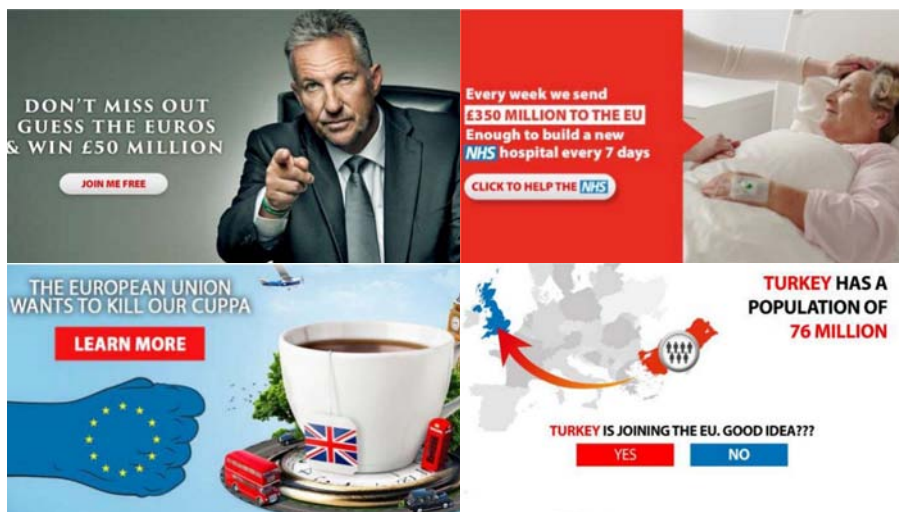
Slika 5. Neki od oglasa koji su obilježili kampanju VoteLeave na društvenoj mreži Facebook.

milijuna funti na tjedan i da bi taj iznos bilo daleko bolje utrošiti na sustav nacionalnog zdravstva (NHS); velik se dio oglasa odnosio na britanske vrijednosti poput ispijanja čaja i zaštite životinja, sugerirajući da ostanak u EU-u te vrijednosti dovodi u pitanje; dio je oglašavanja bio posvećen zastrašivanju Britanaca mogućim članskim širenjem EU-a na Tursku, Albaniju, Makedoniju, Crnu Goru i Srbiju. pri čemu je jedan od oglasa sugerirao opasnost od prelijevanja ukupnog stanovništva Turske na britanske otoke; pojedini su se oglasi referirali, afirmativno ili negativno, na izjave poznatih političara, ponekad s upitnom kontekstualizacijom (primjerice, naslanjanjem na izjave Jeremyja Corbyna iz ranijeg razdoblja) i dr.