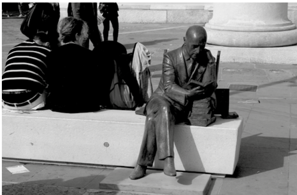
Prilog 7: Spomenik D'Annunzija u Trstu (2019., Autor: Vjeran Pavlaković)

Kao što pokazuju neke kontroverzije iz 2019., primjerice nacionalistička provokacija Vodoinstalatera opisana na početku ovog priloga, D'Annunzio nastavlja opčinjavati, ali i dijeliti znanstvenike u regiji. Zsigurno ne postoji jedna Rijeka pod D'Annunzijem, već mnogo aspekata čovjeka i njegovog političkog eksperimenta koji zahtijevaju ne samo stalna istraživanja nego i dijalog, raspravu, debatu i spremnost na transnacionalno razumijevanje. No, također je važno ne biti previše ometen D'Annunzijanskim spektaklom i zaboraviti kako je ovaj drzak politički eksperiment koji se u Rijeci odvijao od 1919. do 1921. godine dramatično utjecao na živote ljudi, a u mnogim slučajevima ih je i zauvijek promijenio. Nasilje, nacionalizam i kult vođe kasnije su prihvatili razni politički pokreti 20. stoljeća koji su doveli do tragičnih ratova i diktatorskih režima, čiji se tragovi još uvijek mogu vidjeti u suvremenim populističkim pokretima diljem svijeta. D'Annunzio u Rijeci omogućuje nam zamišljanje kreativnog potencijala revolucionarne energije, ali služi i kao upozorenje na opasnosti netolerancije, isključivosti i estetike radikalnog nacionalizma.