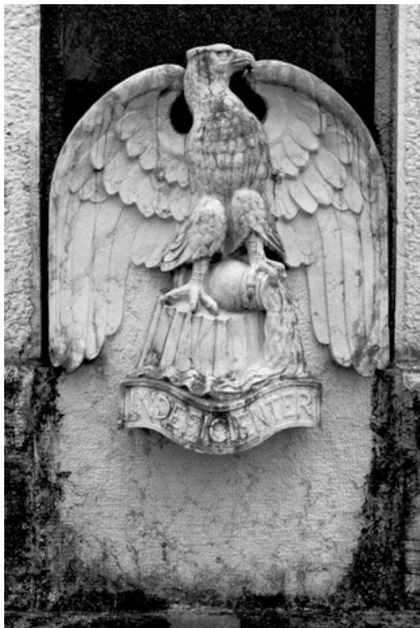
Prilog 2: Riječki orao bez jedne glave na spomeniku u Ronchiju (2019.)