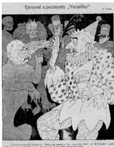
Prilog 6: D'Annunzio baca konfete u lice Clemenceaua, Koprive , 14. veljače 1920.

Dok su bijes i dvojba prema Velesilama rasli kako se kriza odvlačila u 1920., slovenske su i hrvatske novine također svoju kritiku usmjerile na političko središte nove jugoslavenske države, odnosno na nespremnost Beograda da zauzme jači stav u borbi za Rijeku.