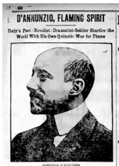
Prilog 4: The Boston Globe , “D'Annunzio, Flaming Spirit,” 21. rujna 1919., str. 60

D'Annunzijevo riječki eksperiment također je bio zanimljiv čitateljima u Sjedinjenim Američkim Državama, budući da su brojni članci objavljeni u svim glavnim novinama, a zatim ponovno tiskani u stotinama lokalnih novina diljem zemlje. S obzirom na to da strani čitatelji nisu bili toliko emocionalno vezani za potencijalne teritorijalne promjene ili unutarnje političke rasprave, članci u američkom tisku često su se fokusirali na lik samog D'Annunzija, često objavljujući dramatične fotografije ili izvještavajući o njegovim brojnim ljubavnicama. Talijansko-američke zajednice s nestrpljenjem su pratile vijesti o D'Annunziju. Čak su bile i domaćini raznih događaja koji su pokazali njihovu potporu njegovom hrabrom osvajanju Rijeke.