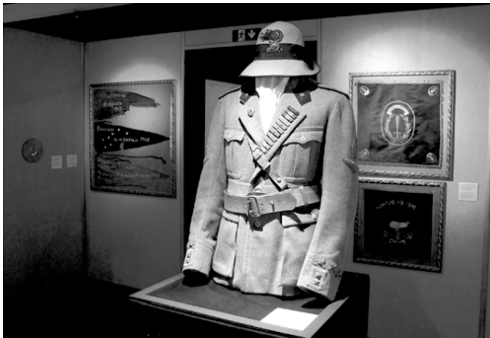
Prilog 1: D'Annunzijeva uniforma na izložbi u Trstu (2019.)

Prvotni cilj ovog rada bio je ispitati kulturno sjećanje na D'Annunzija iz Hrvatske, i šire, iz bivše jugoslavenske perspektive. No, ubrzo je postalo jasno da je točnije ako govorimo o kolektivnoj amneziji, nego o kolektivnom sjećanju na događaje iz 1919.-1921. među građanima Hrvatske ili čak Rijeke. Komunistička historiografija naglašavala je teleološki lanac događaja od D'Annunzijeve protofašističke okupacije Rijeke, do 1924. kada je fašistička Italija zauzela Rijeku te oslobođenja grada 1945. zahvaljujući Titovim partizanima. 5 Iako se D'Annunzijev pothvat ( impresa di Fiume ) često spominjalo kao jedan od prvih činova fašističkog ugnjetavanja koje je okončano tek Narodnooslobodilačkom borbom, vrlo je malo istraživanja povijesničara bilo usmjereno na to razdoblje, posebice na sve što bi moglo osporavati antifašističku stranu priče. Opravdavanje novih granica socijalističke Jugoslavije bilo je od vitalnog značaja, a povijest Istre i Rijeke suprotstavljala je imperijalističku i fašističku talijansku agendu oslobodilačkoj i emancipirajućoj jugoslavenskoj agendi. 6 Nakon raspada