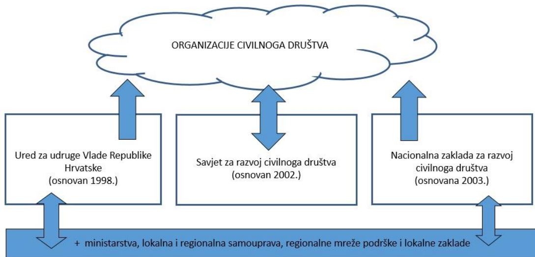
Slika 2. Institucionalni okvir za podršku razvoju civilnog društva u Republici Hrvatskoj (Ured za udruge, 2016).

vijeće (Barić i Dobrić, 2012). Prema Uredu za udruge (2016) navedeni institucionalni okvir prepoznat je kao primjer dobre prakse i izvan Republike Hrvatske.