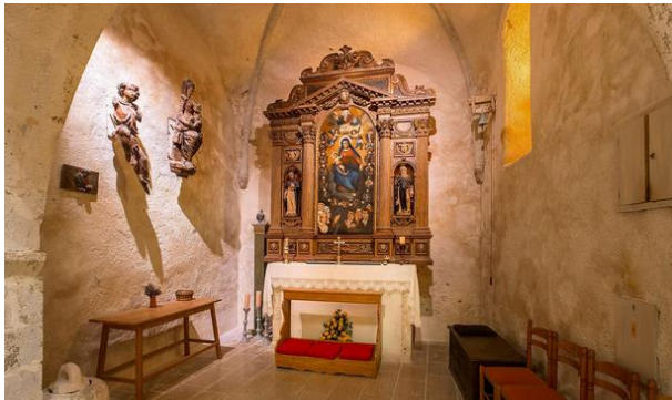
(Slika 4: Preuzeto: https://www.info-krk.com )

stoljeća iz vremena benediktinaca. Kapela je dograđena kasnije kao zavjetna kapela jednoj obitelji, a crkva je korištena kao grobljanska kapela.