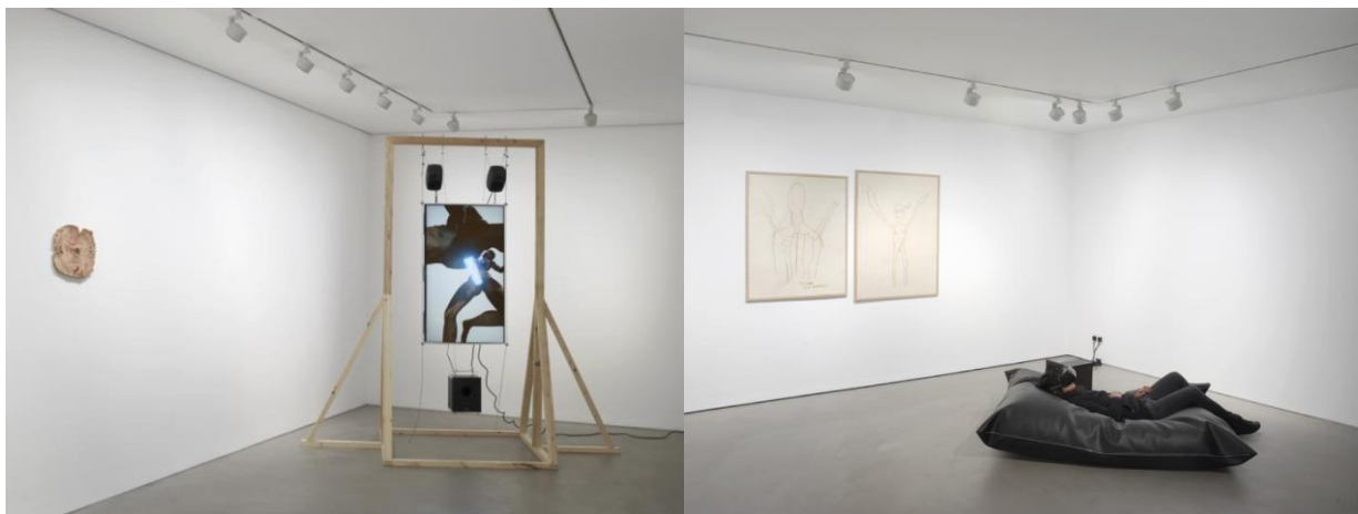
Slika 7. Sidsel Meineche Hansen, Second Sex War , 2016.

Sidsel Meineche Hansen 2016. u Londonu osmišlja izložbu Second Sex War , u čije središte stavlja pornografsku 3D animaciju ženskog lika s kojim promatrač može ući u interakciju koristeći VR naočale (Slika 7.). Tim likom, kojeg naziva Eva v3.0 , Hansen ukazuje na etičke i društvene posljedice virtualne pornografije, pitajući se pomiču li se granice morala kada utječemo na virtualno tijelo umjesto na fizičko. Zašto interakcija s hiperseksualiziranim, realističnim ženskim likom u virtualnoj stvarnosti u promatraču ne izaziva jednaku nelagodu kao interakcija sa stvarnom osobom? Koje su posljedice činjenice da je u današnjem društvu sve lakše stvoriti seksualnog roba sasvim nalik stvarnoj osobi, ali bez moralnih obveza koje dugujemo živom biću? 35