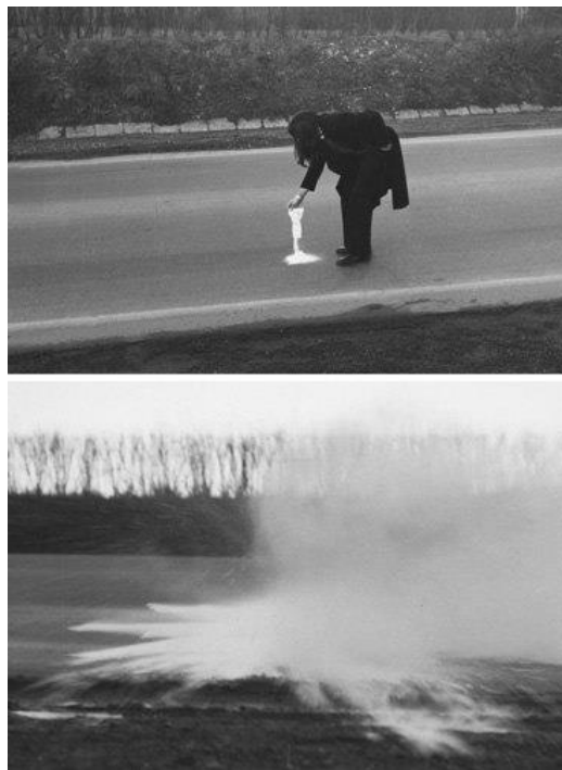
Slika 6. Braco Dimitrijević, Slučajna skulptura , 1968., Zagreb

Radovi Brace Dimitrijevića, uz kolektivnu gerilsku akciju-intervenciju Crveni Peristil u Splitu (1968.), imaju pionirsku ulogu konceptualnih radova – akcija u javnom prostoru na prostorima bivše Jugoslavije. Prvi rad, u nizu svojih radova koji se bave konceptom slučajnosti, Dimitrijević naziva Slučajna slika (1968.). Rad nastaje umjetnikovim prolijevanjem vode po asfaltu. Umjetnik zatim čeka da prođe automobil i potom fotografira tragove kotača na pločniku. U Slučajnoj skulpturi I (1958.) umjetnik prosipa hrpu gipsa na ulicu, a automobil koji prolazi diže oblak prašine i čini ono što umjetnik naziva slučajnom skulpturom. Efemernost oba rada umjetnik zabilježava fotografijom. Riječ je o umjetnikovom specifičnom tretiranju vremena i događaja gdje je efemernost nekog djela, odnosno njegovo trajanje u bljesku trenutka, manje važna od činjenice da se ono dogodilo. 96