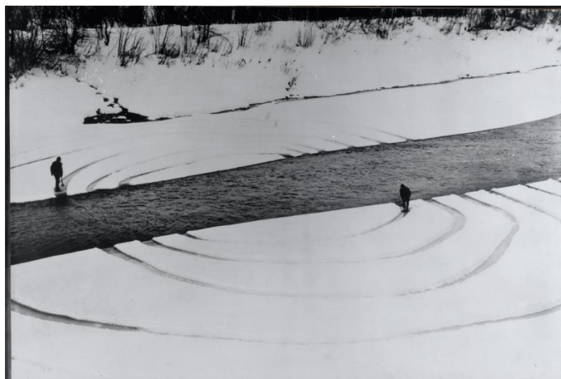
Slika 7. Dennis Oppenheim, Godišnji prsteni , 1968., Kanada, SAD

Realizacije instalacija većih dimenzija u prirodnom krajoliku karakteristične su za američki land art korelirajući s mitom o herojskom otkrivanju i osvajanju dalekog, nepoznatog i divljeg prostora. 99 Rad Godišnji prsteni (1968.) Dennisa Oppenheima izveden je na vodenoj granici SAD-a i Kanade koja dijeli i vremenske zone navedenih država. 100