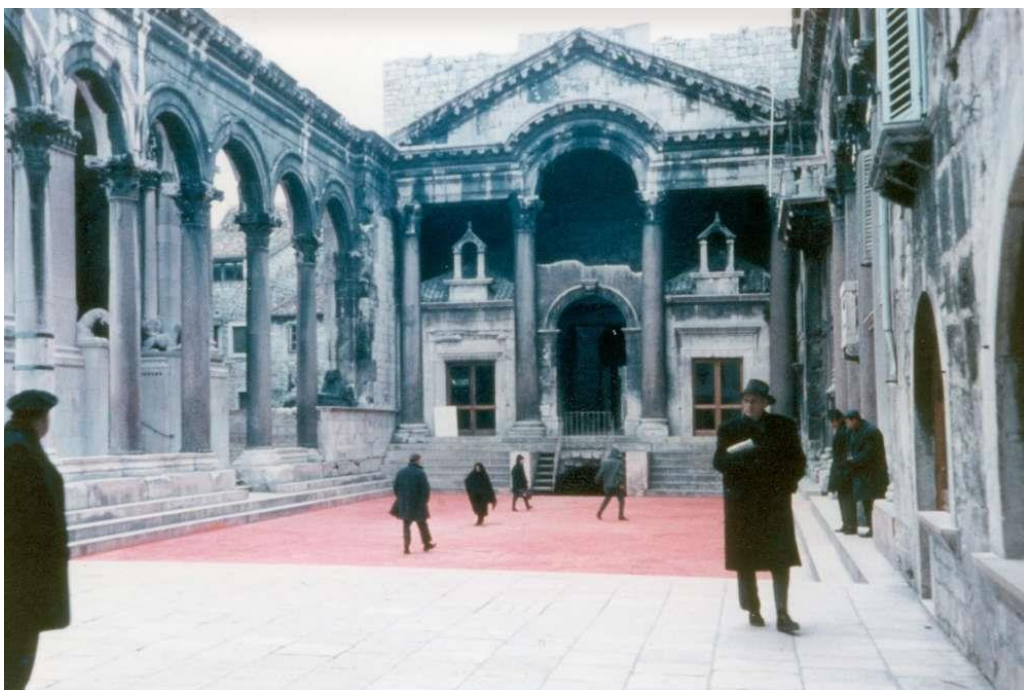
Slika 12. Grupa Crveni Peristil, Crveni Peristil , 1968., Split

Kao primjer privremene, prolazne akcije – suvremene intervencije u javnom urbanom prostoru izvedene kao čin društveno-političke subverzije te kao umjetničkog čina od velikog značaja u kontekstu umjetnosti na ovim prostorima ističe se Crveni Peristil . Riječ je o akciji koja se smatra prvom intervencijom u javni prostor na području bivše Jugoslavije te prvom konceptualnom intervencijom nove umjetničke prakse 154 u Hrvatskoj. 155 Djelo je nastalo u duhu pokreta društvene promjene revolucionarne 1968. godine. U društvu ima status urbane legende i od svoje pojave do danas utjecalo je na niz subverzivnih intervencija na prostoru splitskog peristila.