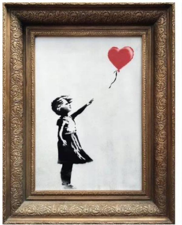
Slika 3. Banksy, Djevojka s balonom , 2006., Privatno vlasništvo

Spektakl kao glavni proizvod današnjeg društva, uz ironiju i kapital kao dominante doba, oprimjeruje rad vjerojatno najpoznatijeg uličnog umjetnika Banksyja Djevojka s balonom iz 2006. godine, koji je za vrijeme dražbe u Sotheby's aukcijskoj kući u Londonu 2018. godine promijenio naziv u Ljubav je u kanti za smeće .