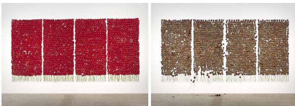
Slika 1. Anya Gallaccio, preserve 'beauty (sačuvati ljepotu) , 1991., Galerija Karsten Schubert, London

Djelo britanske umjetnice Anye Gallaccio preserve 'beauty (sačuvati ljepotu) , prvi puta izvedeno 1991. godine u galeriji Karsten Schubert u Londonu, efemerna je instalacija sastavljena od oko 800 crvenih cvjetova postavljenih između četiri supostavljene staklene ploče. Vrsta cvijeta korištena u instalaciji hibrid je između gerbera i tratinčice koji je poznat pod nazivom „ljepota“ ili „ljepotica“ čime se je u vezu doveden pojam ljepote i cvijeta kao simboličke reprezentacije istog. 4 Cvjetovi tijekom vremena trunu, a promatrač, osim vizualno, djelo doživljava osjetom njuha. Autorica cvjetove tretira kao ready-made objekte koje tek postavlja u događaj. Organski procesi truljenja i raspadanja nakon inicijalne intervencije autorice, izvan njene su kontrole, a rad se odvija prema vlastitim prirodnim zakonitostima pozivajući na razmišljanje o temi vremena, života, propadanja, smrti, ljepote i vječnosti. 5