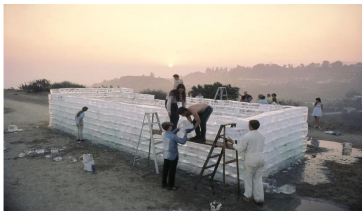
Slika 5. Allan Kaprow, Tekućine , 1967., California

Rad istog autora Tekućine (1967.) okupio je građane/volontere na nekoliko lokacija u Californiji koji su gradili ledene strukture – građevine od velikih blokova leda. Rad u svojoj ideji i provedbi postulira načelo efemernosti koju možemo čitati u ključu kapitalističkog, potrošačkog društva spektakla. Rezultat kolektivnog rada, u ovom je slučaju topljenje, nestajanje koje može simbolizirati unutarnju prirodu ljudskog rada u kapitalističkom društvu – krajnji je proizvod odvojen od radnika, rezultat rada tako je – ništa.