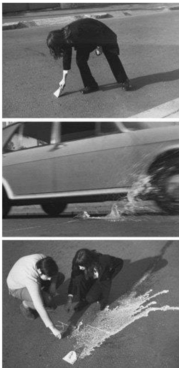
Slika 14. Braco Dimitrijević, Slika Krešimira Klika , 1969., Zagreb

Dimitrijevićev odnos prema relativnosti vremena je izložba At the Moment koju organizira zajedno s Nenom Baljković (Dimitrijević). Riječ je o prvoj međunarodnoj izložbi konceptuale u Zagrebu u autentičnom životnom ambijentu veže stambene zgrade u Frankopanskoj 2a. Izložba je otvorena 23. travnja 1971. i zatvorena nakon tri sata, čime je akcentirana upravo kategorija prolaznosti. 177