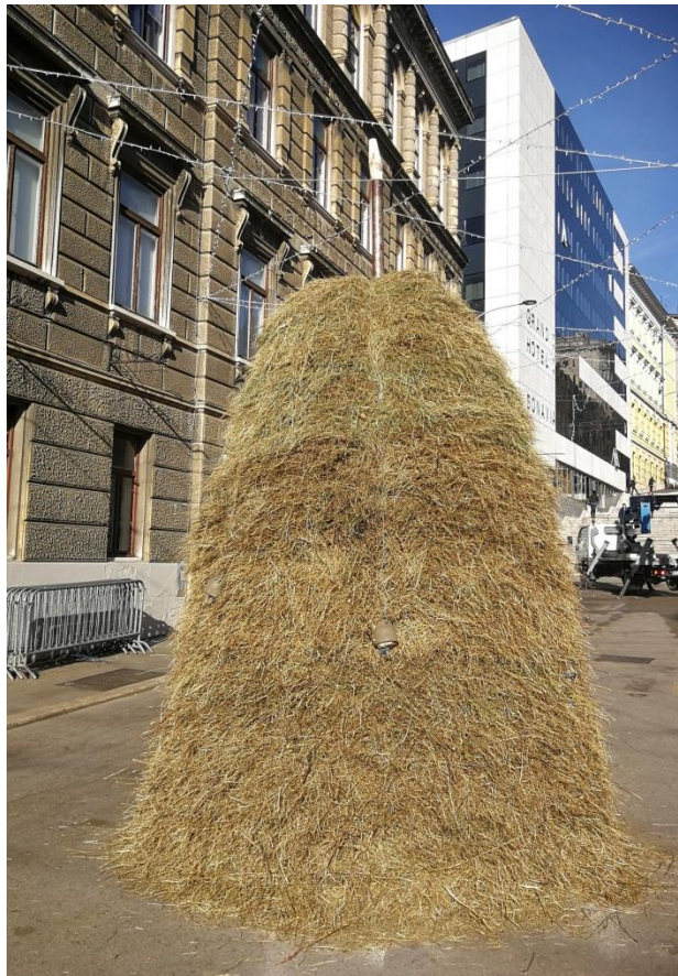
Slika 16. Ivan Kožarić, Stog sijena , 2020., Rijeka

Privremena skulptura (instalacija) Stog sijena Ivana Kožarića postavljena je na riječkom Trgu 128. brigade Hrvatske vojske 8. siječnja 2020. godine. Tri dana kasnije zapalio ju je javnosti nepoznat počinitelj. Instalacija se time pokazala u punom sjaju svoje privremenosti, a izgaranjem i doslovne efemernosti. Nanovo je, na isto mjesto, postavljena 30. siječnja iste godine, gdje se uz nadzor održala do jutra 4. veljače, kada je po planu organizatora i trajno uklonjena, ali ne više kao nepoželjan, već kao umjetnički predmet kojem je javno predstavljanje završilo.