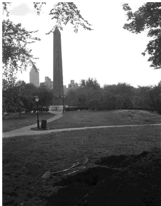
Slika 9. Claes Oldenburg, Placid Civic Monument , 1967., New York