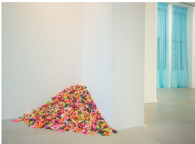
Slika 15. Félix González-Torres, Bez naziva (Portret Rossa u L.A.-u) , 1991.

Bez naziva (Portret Rossa u L.A.-u) iz iste godine, instalacija je koja se sastoji od šarenih bombona težine 79 kilograma, koliko je González-Torresov partner težio prije bolesti i smrti. 197 U središtu umjetničkog rada je problematika zapisivanja onog neopipljivog. Umjetnik uvodi recipijenta u svoje iskustvo žalovanja, sjećanja, u svoju intimnu borbu s tugom, načinom podnošenja prolaznosti. Iako se djelo bavi teškom i potencijalno uznemirujućom temom, svaki element šoka izbjegnut je u korist jednostavnosti, nježnosti i suptilnosti.