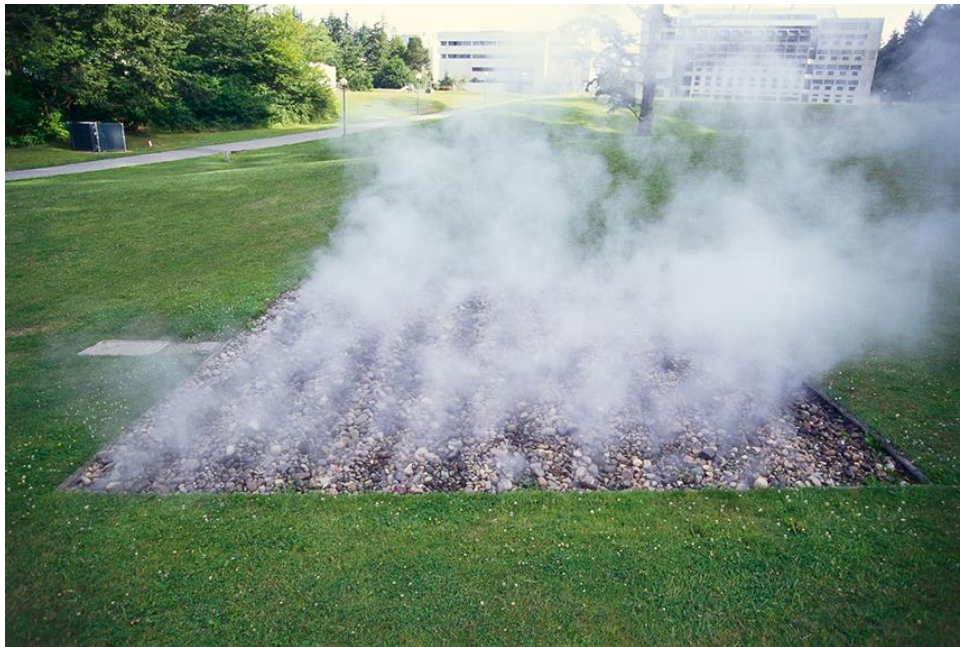
Slika 10. Robert Morris, Bez naziva (Oblak pare za Bellingham) , 1974., Western Washington University, Bellingham

samo je para. 114 Prirodni čimbenici poput sunca, vjetra i kondenzacije utječu na brzinu isparavanja i oblike koje će para formirati. Rad odbija permanentnu estetizaciju oblika; djelo je to koje ne posjeduje stabilnu formu, povezano s okolišem koji ga okružuje i prirodnim uvjetima koji ga određuju. Kada se sustav isključi, ostaje sjećanje na oblik pare i dojam koji je u promatraču djelo izazvalo. Djelo se putem sustava za isparavanje tako svakog dana reizvodi, a efemernost djela odnosi se rezultat rada, odnosno oblik koji para, u odnosu sa svim prirodnim elementima, zadobiva, a koji je svakoga dana nov i neponovljiv i kao takav prolazan.