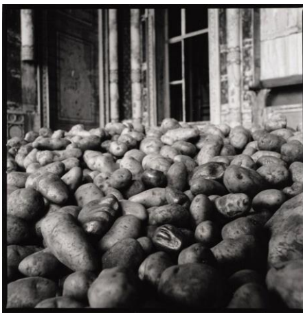
Slika 11. Giuseppe Penone, Patate (Krumpiri) , 1977.

Rad Giuseppea Penonea Patate (Krumpiri) iz 1977. godine, instalacija je koju čine krumpiri i 5 antropomorfnih brončanih komada koji nastaju uzgojem gomolja u posebnim posudama u obliku umjetnikovih usana, ušiju, nosa. (Su)postavljanjem neupadljivog organskog „siromašnog“ materijala u zatečenom stanju – krumpira, koji rastu, trunu, raspadaju se, simbolički se vraćajući zemlji i „visokog“ materijala kao što je bronca, autor poziva na razmišljanje o kozmosu i čovjeku te njegovoj stvaralačkoj sposobnosti. Kako Penone ističe: „Učiniti odljev je banalan čin, ali stvoriti objekt onda kada je fizički nemoguće intervenirati u njegovo stvaranje daje mu sasvim drugačije značenje.“ 118