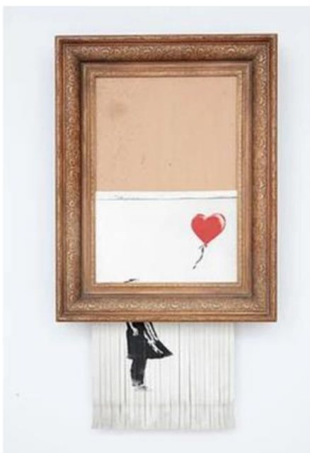
Slika 4. Banksy, Ljubav je u kanti za smeće , 2006. - 2018., Privatno vlasništvo

Riječ je o radu koji se, za vrijeme aukcije i to upravo njegove prodaje za 1.4 milijuna dolara, samouništava, točnije, želi se samouništiti čime akciju možemo označiti efemernom u svojoj intenciji. Djevojka s balonom verzija je Banksyjevog istoimenog grafita izvedena kao akril na platnu, koji je na dražbu pristigao s okvirom također izrađenim od strane autora. Kasnije je na službenim društvenim mrežama autora prikazan video instaliranja rezača za papir u okvir. Rezač, koji je u probnoj fazi svaki puta razrezao djelo u jednake okomite trake tako ga uništavajući, na dražbi je zablokirao i djelo izrezao samo do polovice. Banksy je ovom umjetničkom intervencijom, koju je kasnije na svojim društvenim mrežama popratio Picassovim citatom „nagon za uništavanjem, također je kreativni nagon“, pokazao spektakličnost društva u kojem živimo. Novom je, napola uništenom djelu Ljubav je u kanti za smeće vrijednost porasla te je 2021. godine prodano za 25.4 milijuna dolara. 61 Rad se može čitati u ključu akcije koja subverzira establišment, kao kritika konzumerizma, robne vrijednosti svega pa tako i umjetnosti, kojoj se cijena ironično povećava upravo spektakličnim uništavanjem djela u momentu njegove kupnje.