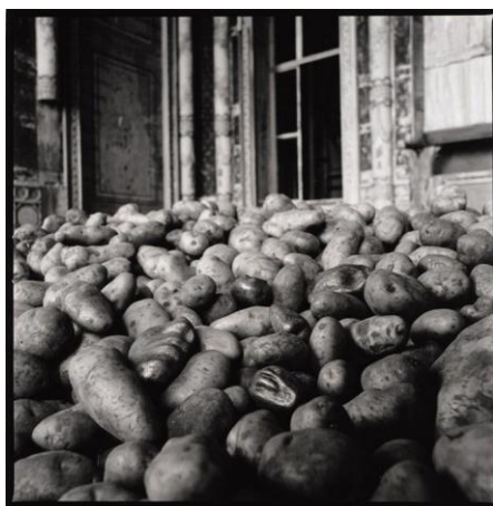
Slika 11. Giuseppe Penone, Patate (Krumpiri) , 1977.

Rad Giuseppea Penonea Patate (Krumpiri) iz 1977. godine, instalacija je koju čine krumpiri i 5 antropomorfnih brončanih komada koji nastaju uzgojem gomolja u posebnim posudama u obliku umjetnikovih usana, ušiju, nosa. (Su)postavljanjem neupadljivog organskog „siromašnog“ materijala u zatečenom stanju – krumpira, koji rastu, trunu, raspadaju se, simbolički se vraćajući zemlji i „visokog“ materijala kao što je bronca, autor poziva na razmišljanje o kozmosu i čovjeku te njegovoj stvaralačkoj sposobnosti. Kako Penone ističe: „Učiniti odljev je banalan čin, ali stvoriti objekt onda kada je fizički nemoguće intervenirati u njegovo stvaranje daje mu sasvim drugačije značenje.“ 118