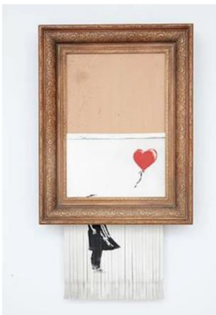
Slika 4. Banksy, Ljubav je u kanti za smeće , 2006. - 2018., Privatno vlasništvo

Riječ je o radu koji se, za vrijeme aukcije i to upravo njegove prodaje za 1.4 milijuna dolara, samouništava, točnije, želi se samouništiti čime akciju možemo označiti efemernom u svojoj intenciji. Djevojka s balonom verzija je Banksyjevog istoimenog grafita izvedena kao akril na platnu, koji je na dražbu pristigao s okvirom također izrađenim od strane autora. Kasnije je na službenim društvenim mrežama autora prikazan video instaliranja rezača za papir u okvir. Rezač, koji je u probnoj fazi svaki puta razrezao djelo u jednake okomite trake tako ga uništavajući, na dražbi je zablokirao i djelo izrezao samo do polovice. Banksy je ovom umjetničkom intervencijom, koju je kasnije na svojim društvenim mrežama popratio Picassovim citatom „nagon za uništavanjem, također je kreativni nagon“, pokazao spektakličnost društva u kojem živimo. Novom je, napola uništenom djelu Ljubav je u kanti za smeće vrijednost porasla te je 2021. godine prodano za 25.4 milijuna dolara. 61 Rad se može čitati u ključu akcije koja subverzira establišment, kao kritika konzumerizma, robne vrijednosti svega pa tako i umjetnosti, kojoj se cijena ironično povećava upravo spektakličnim uništavanjem djela u momentu njegove kupnje.