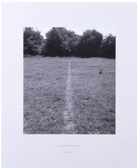
Slika 8. Richard Long, Linija načinjena hodanjem , 1967., Wiltshire

„Minimalne intervencije i ostavljanje tragova u prirodnom prostoru kao oblik dematerijalizacije umjetničkog objekta karakteristično je za europsku procesualnu umjetnost.“ 101 Za razliku od realizacija američkih umjetnika, koje u prirodi često ostavljaju novu makrokonfiguraciju (primjerice radovi Roberta Smithsona Spiralni nasip , Kružna strma visoravan u Amarillu... ), intervencije europskih umjetnika samo su kratkoročno vidljive kao trag postojanja umjetnika u prostoru, brzo obrisan prirodnim uvjetima. 102 Potonje opimjeruje rad Richarda Longa Linija načinjena hodanjem (1967.), koji čini ulegnuta crta u travi načinjena repetitivnim hodanjem istom linijom. Isti senzibilitet ostavljanja tragova u prirodi karakterizira i njegovo kasnije pješačenje bespućima Himalaje, Andi, Aljaske... 103