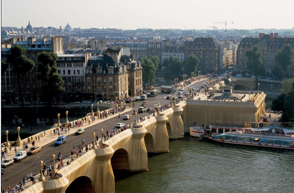
Slika 2. Christo i Jeanne-Claude, Umotani Pont-Neuf , 1985., Pariz