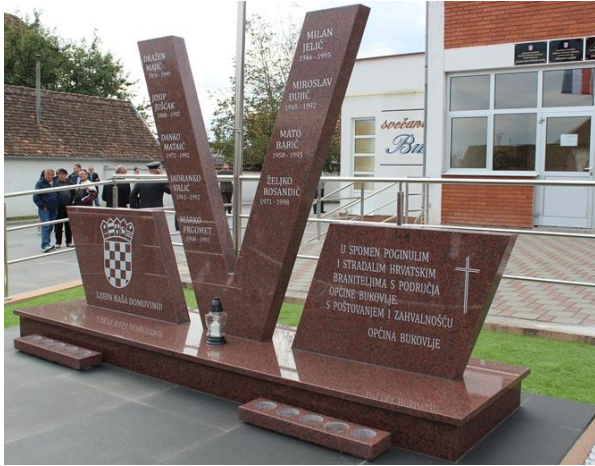
Fotografija 17: Spomenik poginulim i stradalim braniteljima s područja Općine Bukovlje

Općina Bukovlje podigla je 2016. godine spomen-obilježje stradalim braniteljima Bukovlja i okolice. 94 Spomen-obilježje nalazi se ispred same zgrade Općine Bukovlje, a sastoji se od tri mramorne spomen ploče koje stoje na istom postolju. S lijeve strane stoji spomen ploča s hrvatskim grbom ispod kojeg su ispisani stihovi hrvatske himne: LIJEPA NAŠA DOMOVINO! . Središnja ploča u obliku slova V sadrži imena i godine rođenja i smrti 9 branitelja iz Bukovlja, a ploča s desne strane sadrži posvetu braniteljima i križ. Ispod postolja nalaze se dva manja postolja namijenjena postavljanju lampiona.