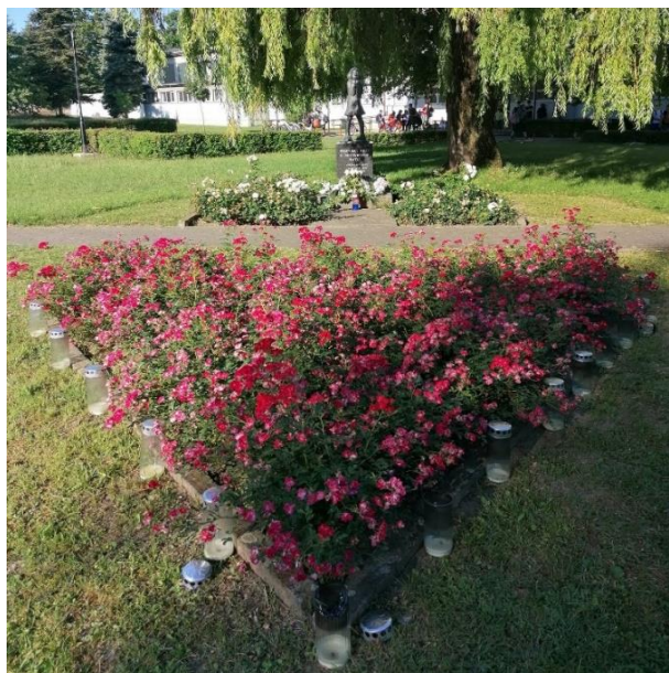
Fotografija 4: Spomenik i okruženje spomenika „Djevojčica“, Slavonki Brod

Posjet ovom spomeniku također dokazuje da je mjesto na kojem se nalazi prilično održavano i uređivano, okruženo cvjetnjakom (slika 4), a posebno mjesto sjećanja postaje za vrijeme obilježavanja teških stradanja djece u gradu.