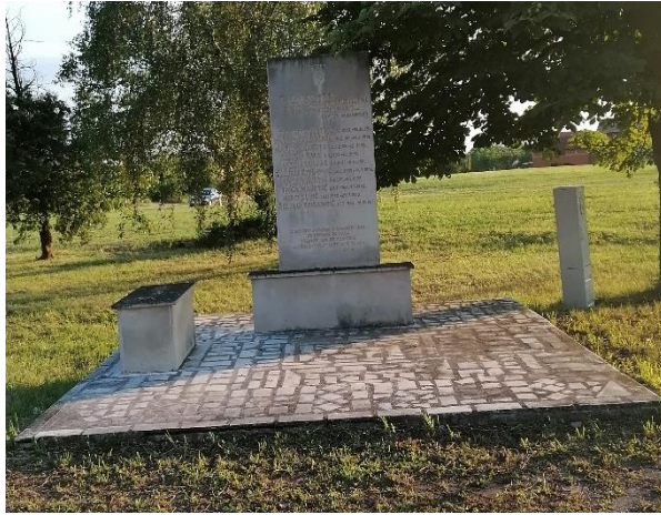
Fotografije 14 i 15: Spomen-obilježje i spomenik braniteljima i članovima NK Podvinje, Slavonski Brod