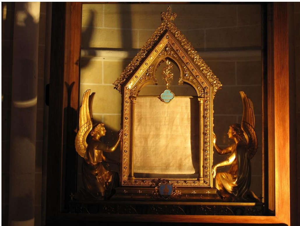
Slika 4. Chartres, katedrala Notre-Dame, Veu Bogorodice, 1. stoljeće