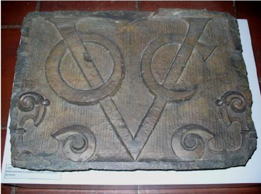
Slika 5- Monogram VOC