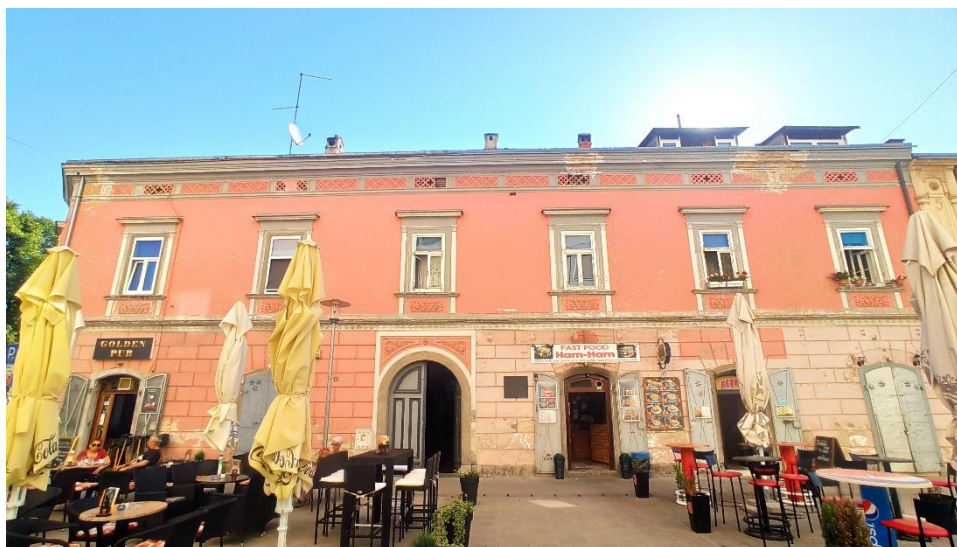
Uglovnica u Šebetićevoj ulici 4 (Kuća Bunette), 1880ih

Uglovnica je sagradila nakon velikog požara 1866. godine obitelj Buneta na mjestu starije drvene kuće u kojoj je osnovana Narodna čitaonica „Ilirskog čitanja društvo“. Kuća ima očuvanu stariju konstrukciju, a pročelje bogatim detaljima profilacije ostvaruje klasifikaciju stila romantičnog historicizma. 186 Raščlamba pročelja u prizemnoj zoni ostvarena je pravokutnim žbukanim poljima glatke plohe. Polje iznad glavnoga polukružnoga ulaza dekorirano je simetričnim elementima vitica i medaljonima. Između prizemne zone i zone kata označeno je dvama vijencima, od kojih je niži dekoriran reljefnim četverolistima, a gornji je vijenac profiliran. Zona kata raščlanjena je pravokutnim prozorima koji su dodatno naznačeni reljefno dekoriranom pravokutnom plohom ispod prozorske klupe. Bočne su strane prozora omeđene uskim pilastrima koji imitiraju funkciju nosača širokog arhitrava čiste plohe iznad prozora, a ispod profiliranog nadstrešnika. Horizontalna traka ispod krovnoga vijenca dekorirana je pravokutnim reljefno razrađenim poljima koja slijede u paru, a između njih je postavljen uski pravokutni otvor s rešetkom koja imitira tranzenu. Zgrada ima prostorije poslovne namjene u prizemlju, dok se na katu nalaze stanovi. 187