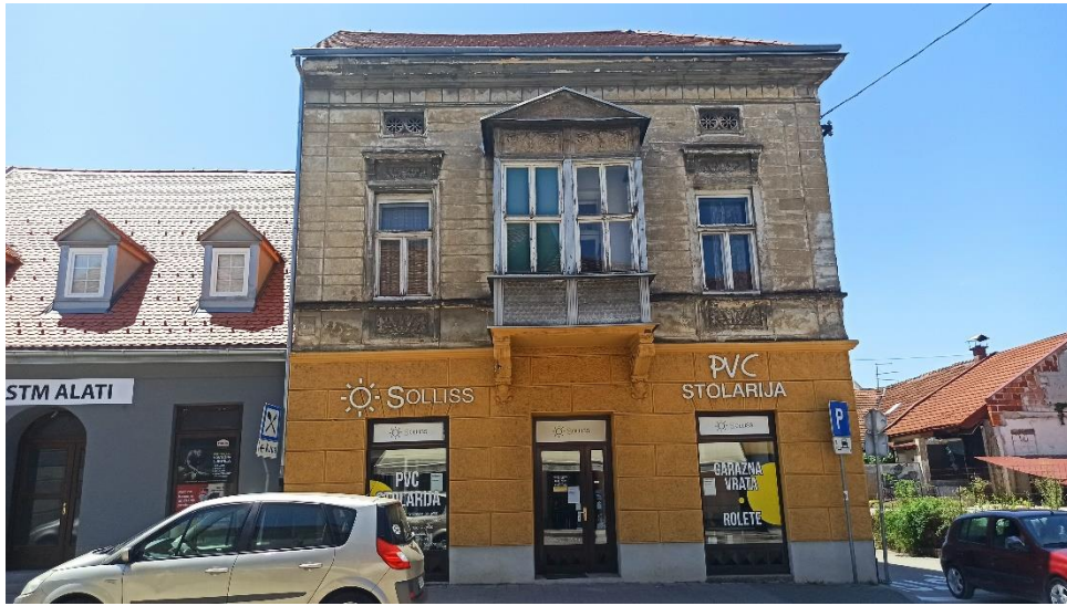
Kuća Balaš na uglu Ulice Banija i Ulice A. K. Miošića, 1874.