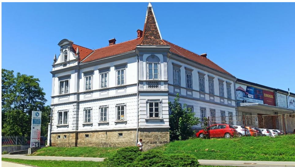
Upravna zgrada Tvornice Ignac Jellenc, 1908., stanje danas (1. 7. 2022.)