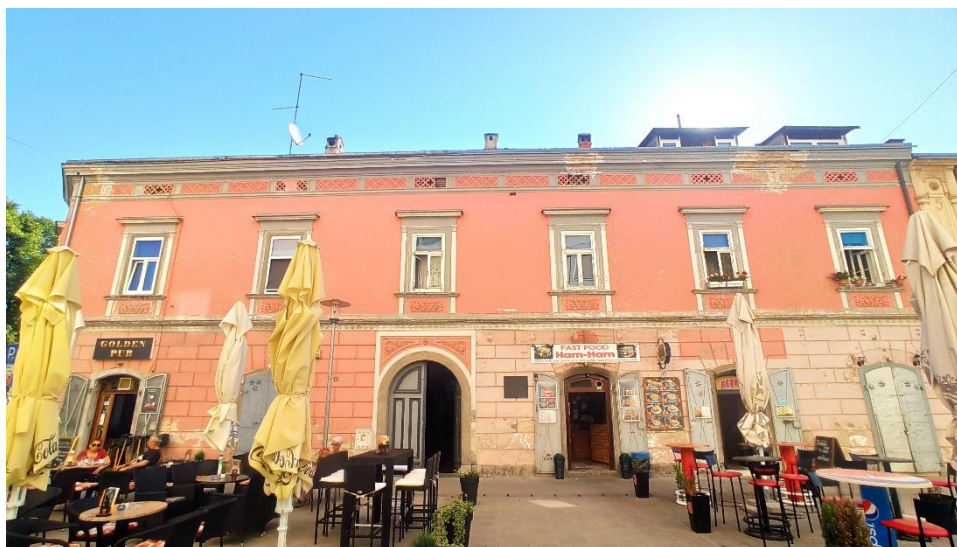
Uglovnica u Šebetićevoj ulici 4 (Kuća Bunete), 1880ih

Uglovnicu je sagradila nakon velikog požara 1866. godine obitelj Buneta na mjestu starije drvene kuće u kojoj je osnovana Narodna čitaonica „Ilirskog čitanja društvo“. Kuća ima očuvanu stariju konstrukciju, a pročelje bogatim detaljima profilacije ostvaruje klasifikaciju stila romantičnog historicizma. 186 Raščlamba pročelja u prizemnoj zoni ostvarena je pravokutnim žbukanim poljima glatke plohe. Polje iznad glavnoga polukružnoga ulaza dekorirano je simetričnim elementima vitica i medaljonima. Između prizemne zone i zone kata označeno je dvama vijencima, od kojih je niži dekoriran reljefnim četverolistima, a gornji je vijenac profiliran. Zona kata raščlanjena je pravokutnim prozorima koji su dodatno naznačeni reljefno dekoriranom pravokutnom plohom ispod prozorske klupe. Bočne su strane prozora omeđene uskim pilastrima koji imitiraju funkciju nosača širokog arhitrava čiste plohe iznad prozora, a ispod profiliranog nadstrešnika. Horizontalna traka ispod krovnoga vijenca dekorirana je pravokutnim reljefno razrađenim poljima koja slijede u paru, a između njih je postavljen uski pravokutni otvor s rešetkom koja imitira tranzenu. Zgrada ima prostorije poslovne namjene u prizemlju, dok se na katu nalaze stanovi. 187