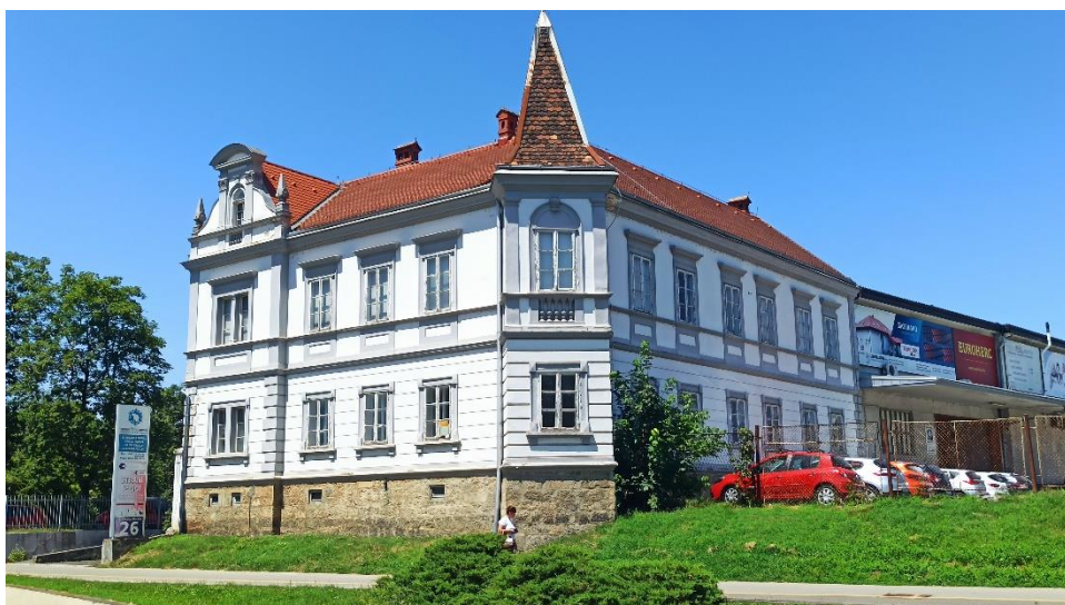
Upravna zgrada Tvornice Ignac Jellenc, 1908., stanje danas (1. 7. 2022.)