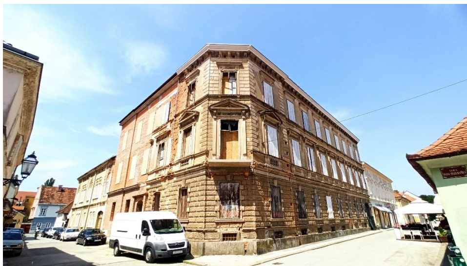
Zgrada Srpske pravoslavne općine u Radićevoj ulici 14, 1882. (29. 6. 2022.)