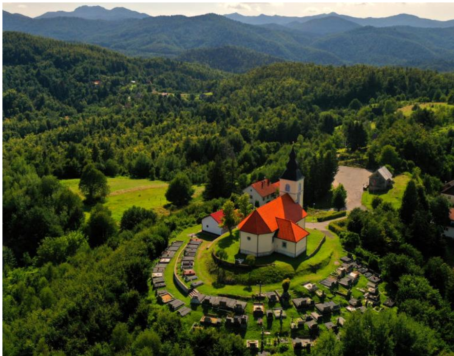
Slika 15. Crkva sv. Leonarda u Hribu