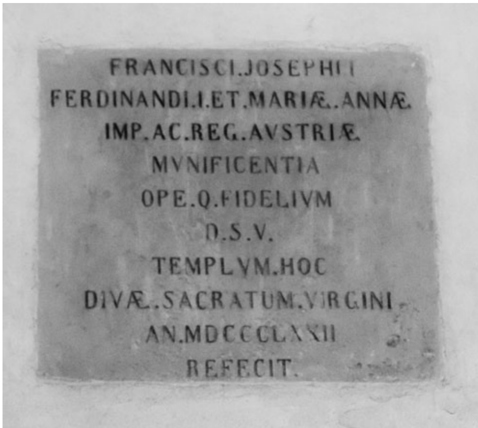
Sl. 5. Posvetna ploča crkve Rođenja BDM (1872.)