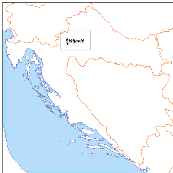
Karta 1: Šišljavić na karti Republike Hrvatske.