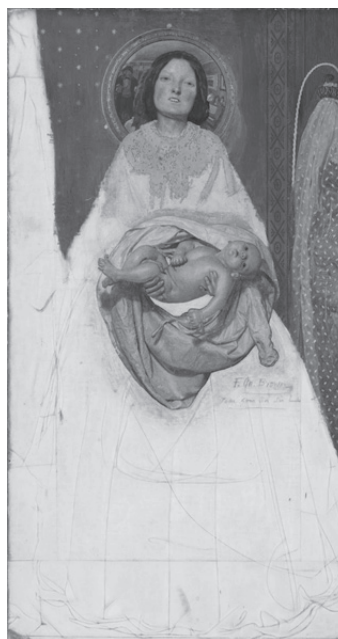
Sl. 1. Gore: Jenna Coleman kao kraljica majka, Viktorija, 2. sezona, 6. epizoda, ITV, 2017. Screenshot (DVD). Dolje: Ford Madox Brown, Take your Son, Sir! (Uzmite svoga sina, gospodine!), 1851.

Povijesni izvori također pokazuju kako je niz irskih uglednika pokušavao utjecati na vladu putem otvorenih pisama kraljici u kojima su joj se obraćali, poput tuamskog katoličkog nadbiskupa Johna MacHalea, kao “brižnoj majci svoga naroda” (Murphy, 2001: 68), apelirajući na njezine majčinske osjećaje. Nedostatak pravovremene reakcije same kraljice (istočnu, gladu najmanje načetu, Irsku prvi puta će posjetiti tek sredinom 1849, i to brodom, držeći se na sigurnoj udaljenosti od potencijalno opasne gomile) i neadekvatan odgovor londonske vlasti postupno su stvorili irsku nacionalističku sliku o kraljici Viktoriji kao “kraljici gladi” (eng. the Famine Queen ), sliku koju će na efektan način iskoristiti irska aktivistica i Yeatsova muza Maude Gonne. U, od britanske vlade ekspresno zabranjenom, polemičkom članku naslovljenom “Kraljica gladi” povodom Viktorijinog drugog državnog posjeta Irskoj 1900. upriličenog prvenstveno kako bi se Irce vrbovalo za britanski rat s Burima u Južnoj Africi, Gonne jetko izjavljuje: