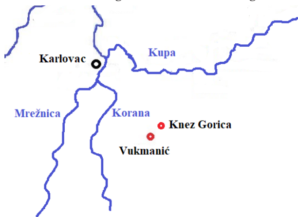
Karta 2. SmjeŹtaj Vukmanića i Knez Gorice

na i Banovine, Vojničem, Gornjom Trebinjom, Sjeniĉakom, Źivković Kosom (Petrović 1978:7–20). Osim Źtokavskoga Tušilovića, prema zapadu ih u meĉurijeĉju Korane i MreŹnice omeĉuju govori Ladvenjka, Barilovića i okolnih zaselaka, odnosno govori »kajkavsko-ikavskoga narjeĉja, koje je nastalo na ĉakavskoj bazi« (TeŹak 1959:456). Sa sjeverne strane graniĉe takoeĉer s govovima razliĉitih osnovica: sa Źtokavskim Popović Brdom i mi-jeŹanim, kajkavsko-ĉakavskim govovima karlovaĉkoga Pokuplja.