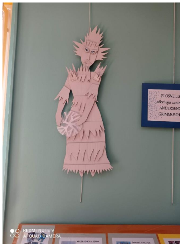
Slika 3. Plošne lutke