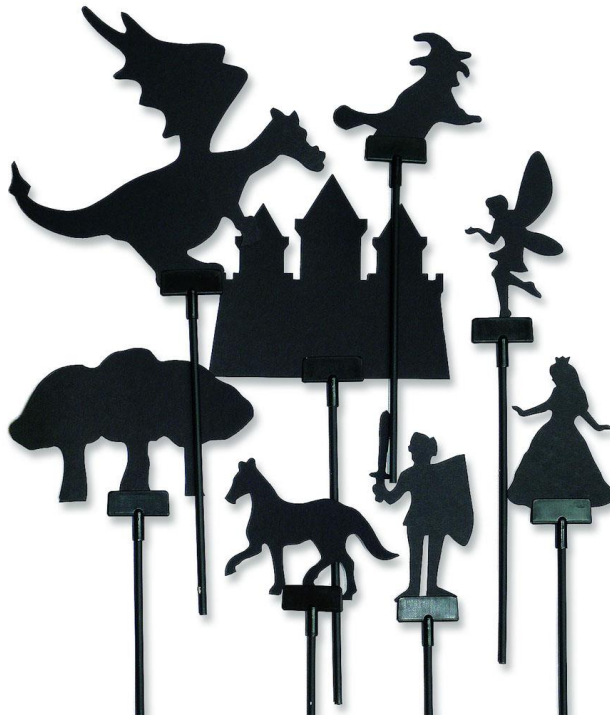
Slika 4. Lutke sjene