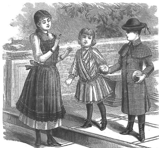
Slika 1: Žena s djecom 25

nije se brinula o vlastitoj djeci, već je o njima vodila brigu dadilja, kasnije kinderfrajla i napokon guvernanta. 24