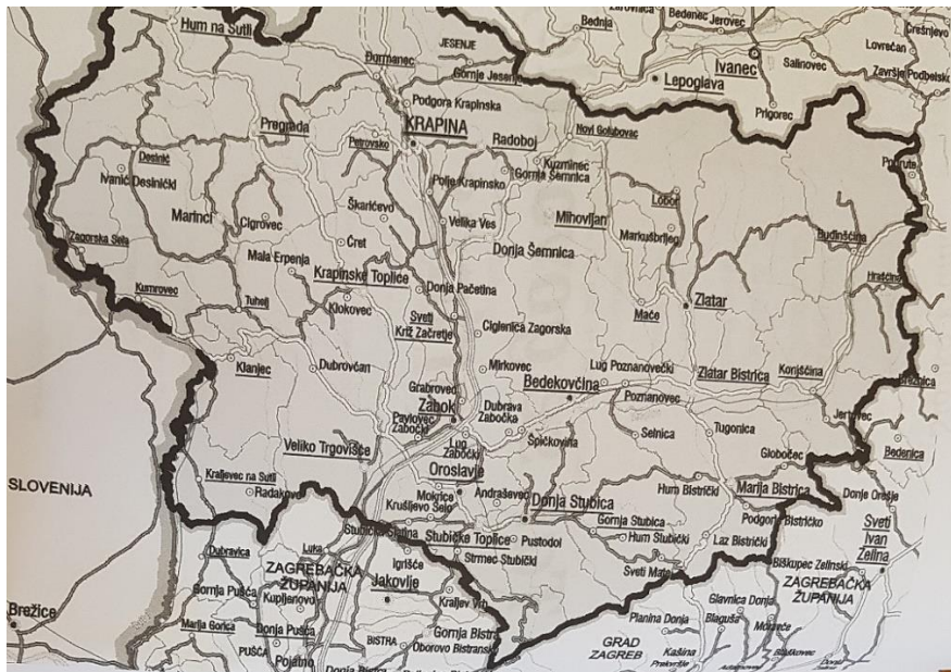
Karta 1. Geografski smještaj Zlatara unutar Krapinsko-zagorske županije (Vranić 2010: 4)