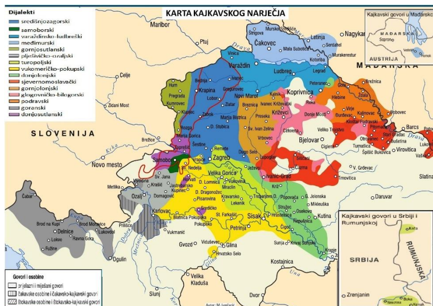
Karta 2. Prostiranje bednjanskozagorskoga dijalekta na karti kajkavskoga narječja (Lončarić 2005: 110)