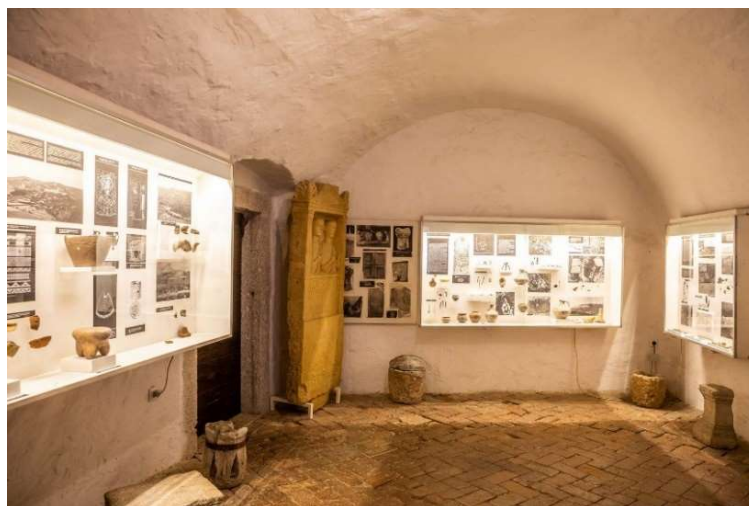
Slika 3. Pazinština od prapovijesti do srednjeg vijeka

Na međukatnoj razini (između prvoga i drugoga kata) Muzej je grada Pazina kao dio stalnog postava smjestio izložbu o životu i djelovanju biskupa Jurja Dobrile. Segment je to koji se nadovezuje na jednu veću izložbu o životu i djelu biskupa koja je smještena u njegovoj rodnoj kući u Velom Ježenju. 73 Rodna kuća pod ingerencijom je Muzeja grada Pazina.