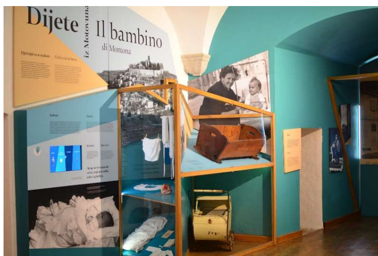
Slika 2. Predmeti iz prostorije posvećene djevojčici iz Motovuna