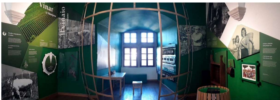
Slika 1. Druga prostorija stalnog postava Etnografskog muzeja Istre