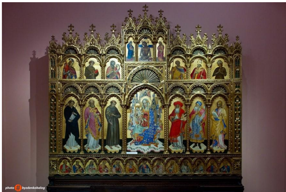
Slika 1, Ugljanski poliptih

https://prigorski.hr/unesco-v-svjetski-dan-umjetnosti-obiljezavat-ce-se-15-travnja-pocev-od-2020-godine/ , preuzeto: 12.09.2023