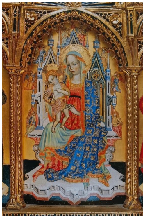
Slika 2, detalj središnje ploče Ugljanskog poliptiha, (HILJE, 1999, str. 11)

https://prigorski.hr/unesco-v-svjetski-dan-umjetnosti-obiljezavat-ce-se-15-travnja-pocev-od-2020-godine/ , preuzeto: 12.09.2023