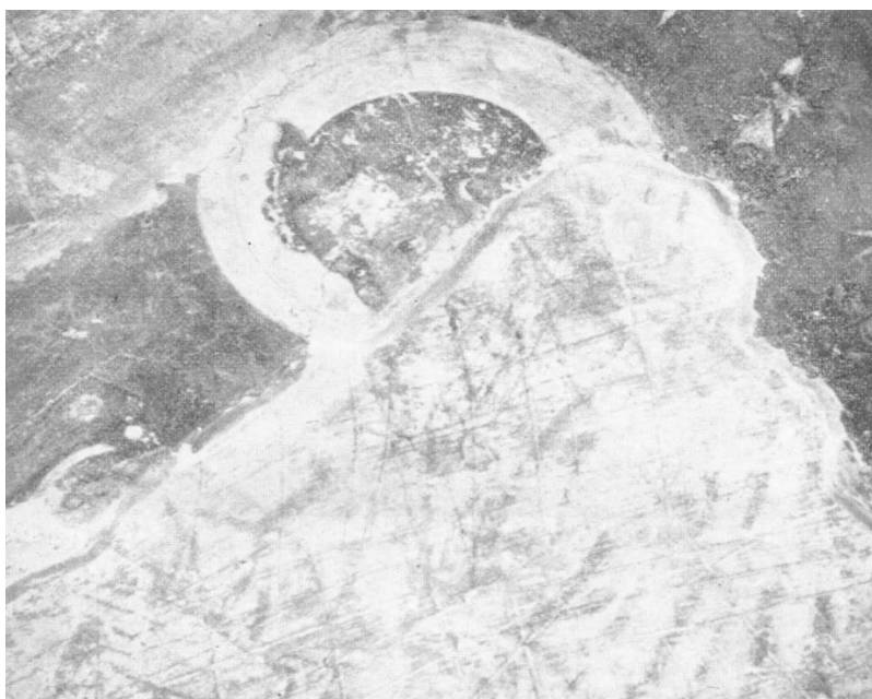
Slika 4. Detalj freske u kapeli Sv. Duje u Splitu. Evandelist Luka (DOMANČIĆ, 1959, str. 43)