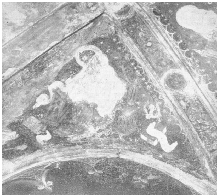
Slika 3. Detalj freske u kapeli Sv. Duje u Splitu. Evandelist Luka (DOMANČIĆ, 1959, str. 42)