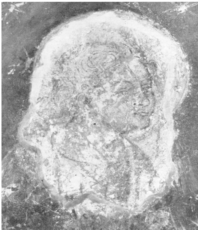
Slika 5. Detalj freske u kapeli Sv. Duje u Splitu. Evanđelist Ivan (DOMANČIĆ, 1959, str. 46)