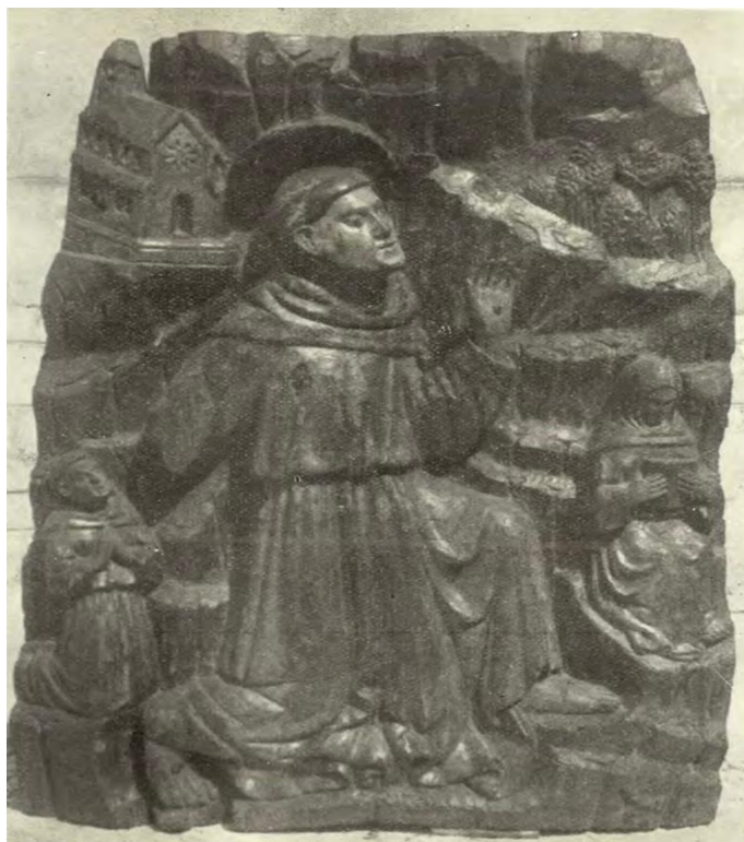
Slika 6. Fragment poliptiha Petra de Riboldisa. Stigmatizacija. (FISKOVIĆ, PETRICIOLI, 1956, str. 160)