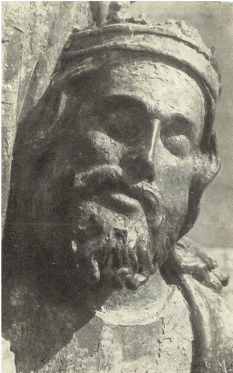
Slika 8. Fragment poliptiha Petra de Riboldisa. Kristova glava. (FISKOVIĆ, PETRICIOLI, 1956, str. 156)