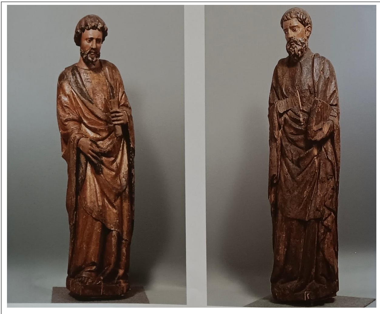
Slika 11. Skulpture sa ograde svetišta zadarske katedrale. (PETRICIOLI, 2004, str. 78)