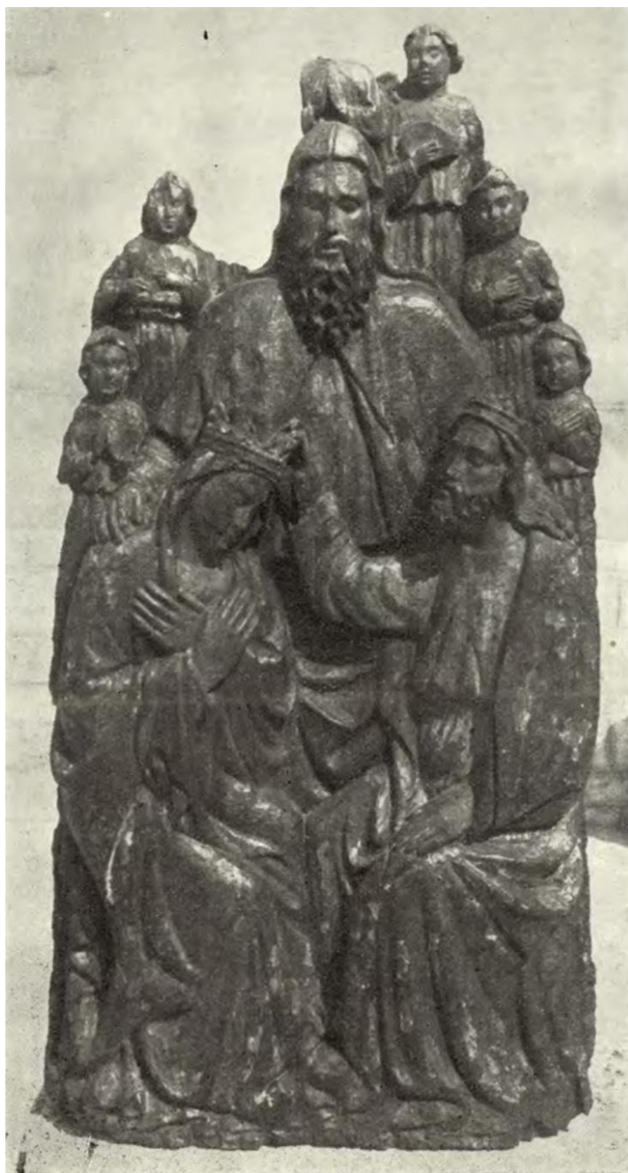
Slika 7. Fragment poliptiha Petra de Riboldisa. Krunjenje Marije. (FISKOVIĆ, PETRICIOLI, 1956, str. 155)