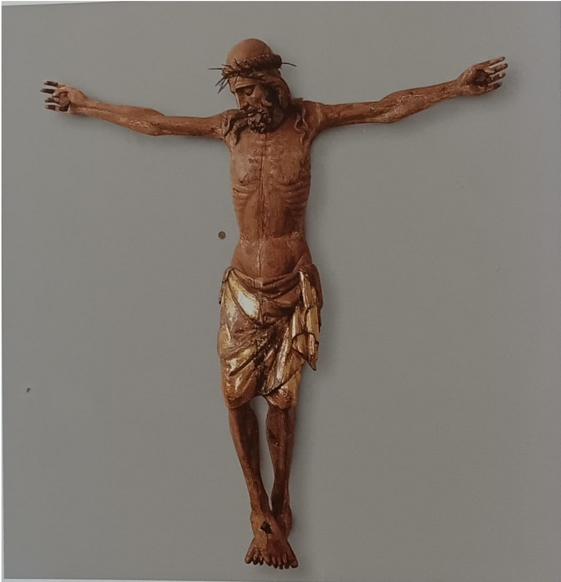
Slika 10. Fragment raspela sa ograde svetišta zadarske katedrale. (PETRICIOLI, 2004, str. 76)