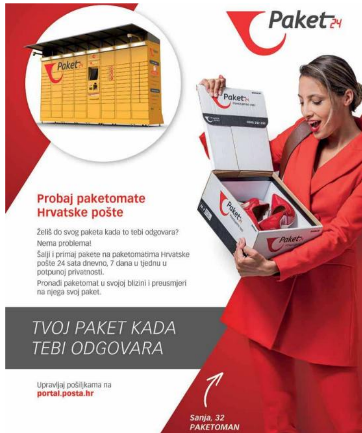
Slika 15. Reklama za paketomate Hrvatske pošte (Gloria, lipanj 2021., broj 1381)

opskrbiti sebe, dom i djecu sa svime što joj je potrebno. Naravno, ne mora značiti da je kreator reklame imao upravo ovu ideju, no stereotip je svakako vidljiv već u prvoj rečenici. Da su žene one koje uživaju u kupovini, trošenju novaca i naručivanju različitih proizvoda, govori nam i sljedeća reklama: