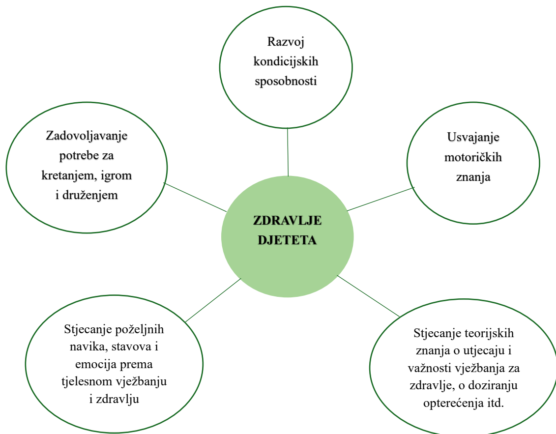
Slika 1. Ciljevi tjelesnog vježbanja (Maršić i Paradžik, 2005)

razumiju kako njihova tijela funkcioniraju i kako pravilno pristupiti tjelesnim aktivnostima. Jedan od ciljeva je usmjerenost na razvoj motoričkih vještina i koordinacije kroz fizičke aktivnosti. Razvoj motoričkih sposobnosti pomaže djeci u svakodnevnim aktivnostima.