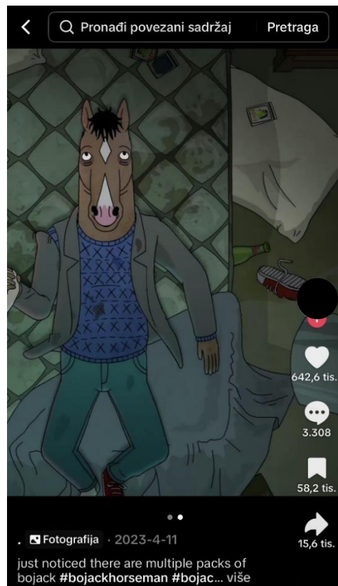
Slike 2 i 3: Kultura malodušnosti na društvenim mrežama na primjeru BoJacka i Sare Lynn