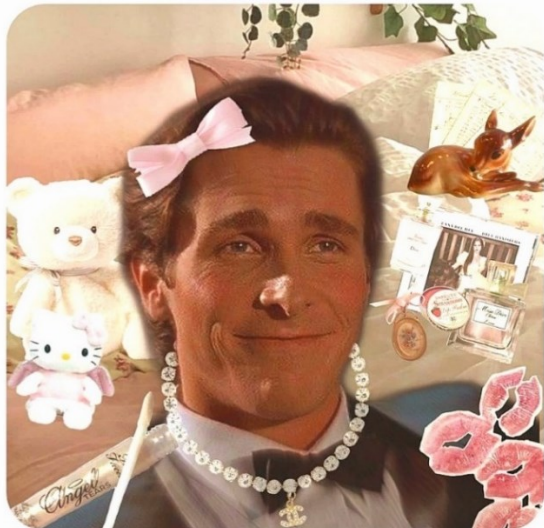
Slika 5: Prikaz Patricka Batemana u kontekstu girlblogger zajednice (@billu_cheesecake na Pinterestu).

Sagledavši načine na koji određeni sadržaj dopijeva u vizualnu produkciju girlblogger zajednice, potrebno je dalje shvatiti što se s njim dalje radi. Kako i Hall tumači, da bi se medijska komunikacija ostvarila u punom smislu te riječi, dekodirana se značenja u konačnici moraju preoblikovati u diskurs, koji će pak naknadno zaživjeti u društvenim praksama.