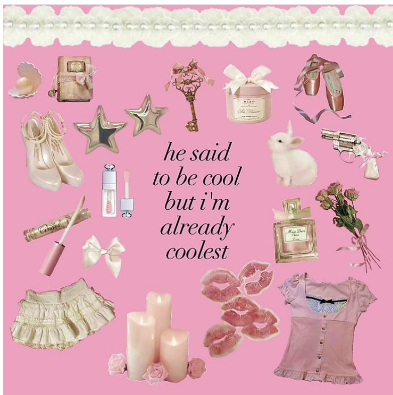
Slika 6: Primjer kontekstualno ženstvenih motiva popraćenih tekstom iz pjesme Lane Del Rey (@Angelskiss InSpring na Pinterestu).

distribuciju hiperženstvenih motiva tako u konačnici ne moduliraju kalupe u koje društvene norme postavljaju djevojke, tj. ne odbacuju stereotipno ženski karakterni i materijalni izričaj, već ih održavaju aktivnima, prekrivajući ih plaštem nedodirljivosti od njihovog sustavnog omalovažavanja i marginalizacije u javnom diskursu. Girlbloggerice stoga ne sudjeluju u radikalnom eliminiranju ženskih stereotipa već primarno suzbijaju njihove masovne degradirajuće interpretacije, težeći pritom javnom centriranju afirmativnog prihvaćanja tih stereotipa.