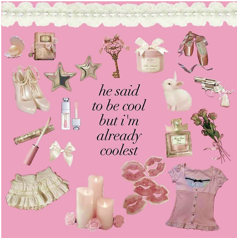
Slika 6: Primjer kontekstualno ženstvenih motiva popraćenih tekstom iz pjesme Lane Del Rey (@Angelskiss InSpring na Pinterestu).

distribuciju hiperženstvenih motiva tako u konačnici ne moduliraju kalupe u koje društvene norme postavljaju djevojke, tj. ne odbacuju stereotipno ženski karakterni i materijalni izričaj, već ih održavaju aktivnima, prekrivajući ih plaštem nedodirljivosti od njihovog sustavnog omalovažavanja i marginalizacije u javnom diskursu. Girlbloggerice stoga ne sudjeluju u radikalnom eliminiranju ženskih stereotipa već primarno suzbijaju njihove masovne degradirajuće interpretacije, težeći pritom javnom centriranju afirmativnog prihvaćanja tih stereotipa.