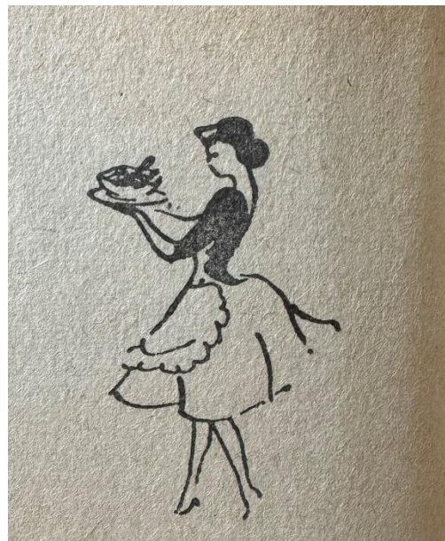
Žena u obavljanju kućanskih poslova, Knjiga za svaku ženu, 1965., str. 378 (lijevo), 380 (desno)