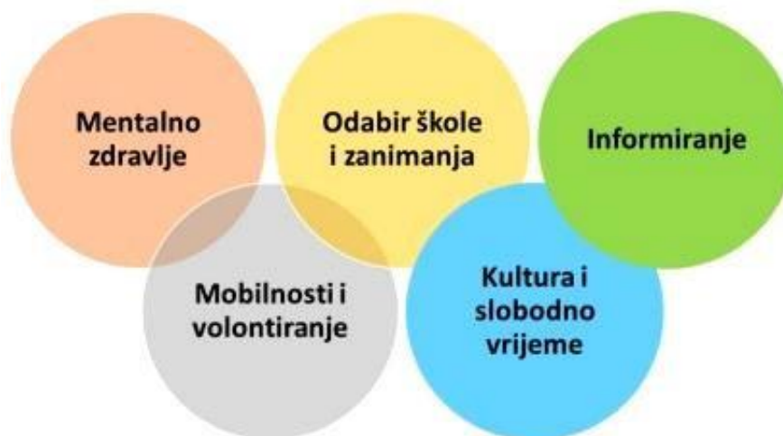
Slika 2. Prioriteti mladih