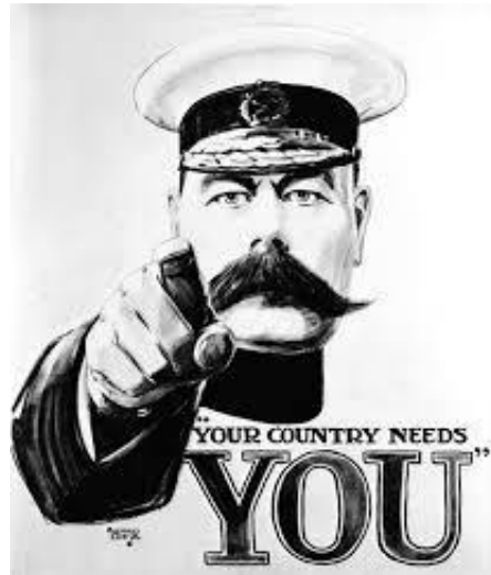
8 Poznati britanski plakat

Tiskani mediji igrali su ključnu ulogu u širenju propagandnih poruka. Novine su svakodnevno objavljivale vijesti koje su često bile pod strogom cenzurom kako bi se osigurala kontrola nad informacijama i održao moral građana. Priče o hrabrosti vojnika, uspjesima na bojištu i okrutnostima neprijatelja bile su uobičajene teme. (D. Monger, 2014.) U Njemačkoj, vlada je koristila slične taktike kako bi potaknula patriotske osjećaje i mobilizirala podršku za rat