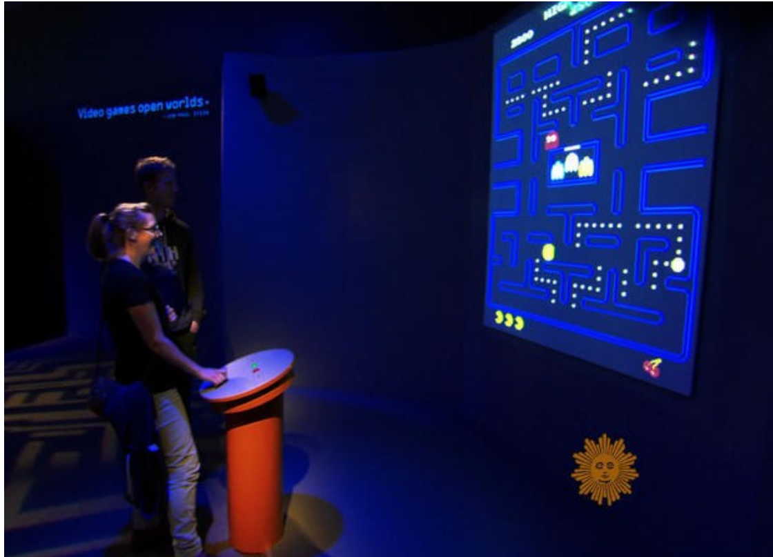
Slika 5 Posjetitelj igraju Pac-man na izložbi „The Art of Videogames“u Smithsonian American Art Museum, CBS, https://www.cbsnews.com/pictures/the-art-of-video-games-exhibit-opens-at-smithsonian/4/

dodijelio industriji videoigara poreznu subvenciju. Tada su dva francuska dizajnera igara, Michel Ancel i Frédérick Raynal, te japanski dizajner videoigara Shigeru Miyamoto uvršteni u Ordre des Arts et des Lettres. (Crampton, T., 2006) Još jedan primjer priznavanja videoigara od strane institucija ostvaren je u svibnju 2011. godine kada je Nacionalna zaklada za umjetnost Sjedinjenih Američkih Država u procesu prihvaćanju prijava za umjetničke projekte za 2012. godinu uključila „interaktivne igre“ u proces (Funk, J., 2011). Time je SAD priznao videoigre kao oblik umjetnosti.