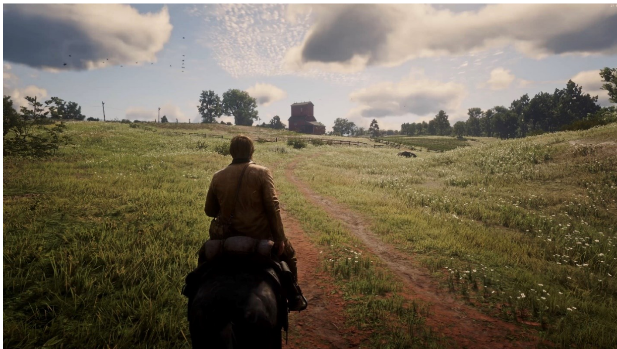
Slika 3 Primjer gotovo savršenog fotorealizma u videoigri Red Dead Redemption 2 pomoću moda, https://80.lv/articles/a-photorealistic-mod-for-red-dead-redemption-2/

I Dutton i Gaut ističu vještinu i virtuoznost izvedbe kao važne kriterije umjetnosti. Videoigre često prikazuju visok stupanj vještine dizajnera i razvojnih timova, koji stvaraju estetska i interaktivna iskustva. Takva iskustva su stvarana različitim metodama animacije, 3D modeliranja, teksturiranja i slično (Vigato, 2019: 16). U usporedbi s nekim tradicionalnim oblicima umjetnosti koji gube vještinu u izvedbi, videoigre jasno pokazuju vještinu kroz kreaciju realističnih i stilski različitih vizualnih reprezentacija. Suvremene igre napreduju, posebno u računalnoj grafici te se fotorealizam u videoigrama sve više približava savršenstvu.