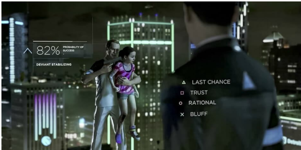
Slika 9 Schreenshot Detroit: Become Human