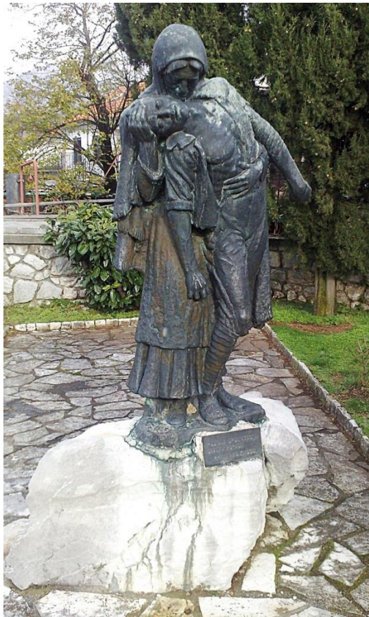
Slika 12: Zvonko Car: Spomenik palim borcima, Hreljin, (1956.)