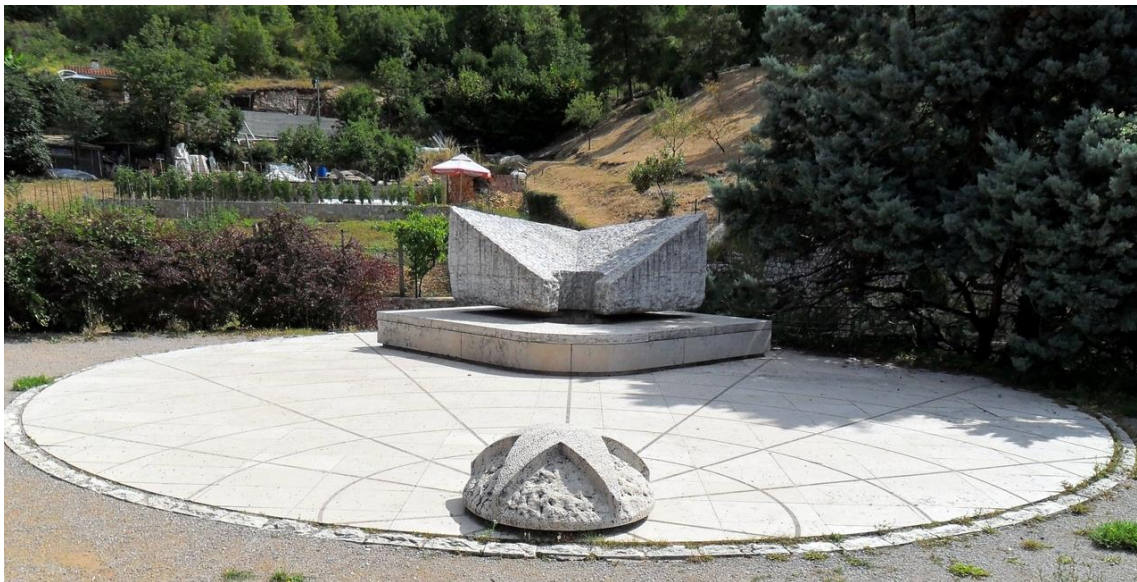
Slika 22: Vlasta Šušanj: Spomenik palim borcima, Škurinje, (1980.)