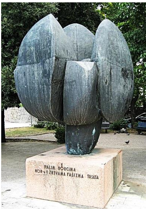
Slika 18: Ljubo de Karina: spomenik palim borcima, Trsat, (1977.)