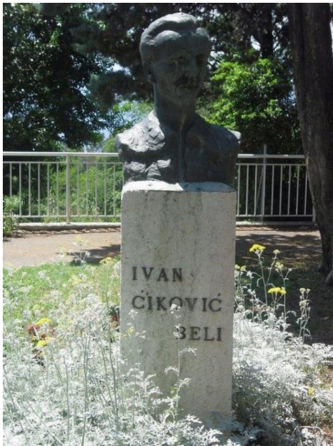
Slika 2: Zvonko Kamenar: Ivan Ćiković-Beli