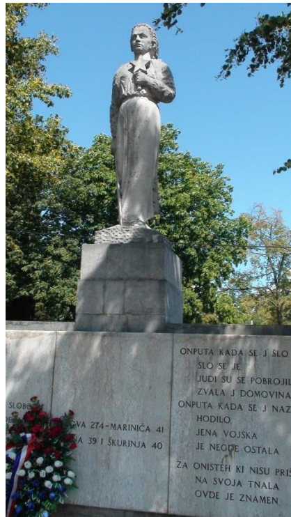
Slika 19: Spomenik palim borcima i žrtvama Viškova, Pehlina i Škurinja, Viškovo, (1950.)