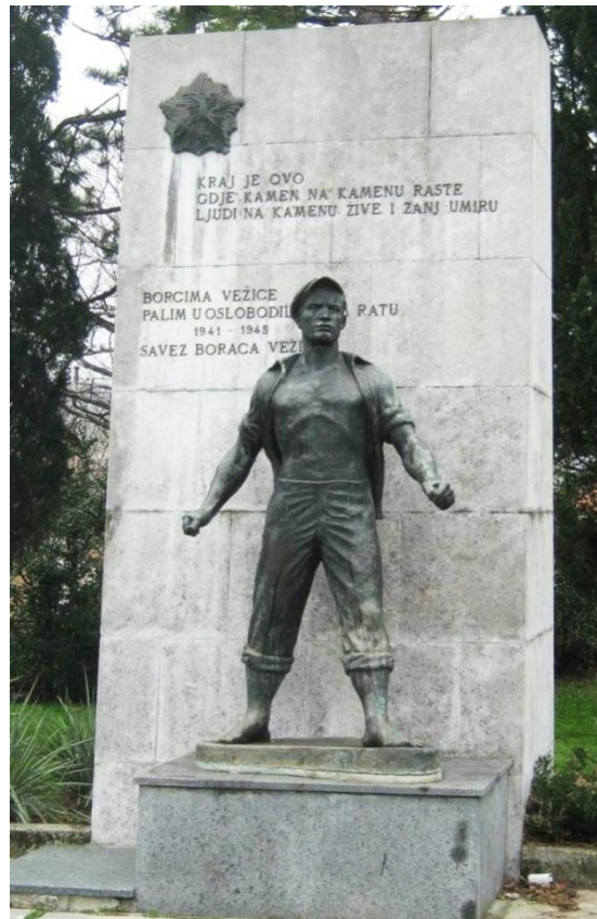
Slika 6: Vinko Matković: spomenik palim borcima, Vežica, (1959.)

Spomenik palim borcima, posvećen radnicima Vežice, nastao je 1959. godine. I ovaj je, kao i mnogi Matkovićevi spomenici preuzeo je shemu realističnog borca. Postavljen je na podestu od kamenih blokova koji sadrže tekst: „Kraj je ovo gdje kamen na kamenu raste ljudima na kamenu žive i žanj umiru“. Na drugom se kamenom podestu nalazi figura radnika, atletske građe sa ponovljenom karakteristikom realistične manire, te geste suzdržane snage i odlučnosti. Razaznaju se već poznati kodirani kiparski modeli koji su bili uzori jednom običnom čovjeku a bliski radnim ljudima. Spomenik je postavljen u blagom kontrapostu, da bi se naglasilo istupanje za prava radnika. Iako nema oružje, možemo razabrati emocije bunta i revolta koji se javljaju u snazi radnika. 86