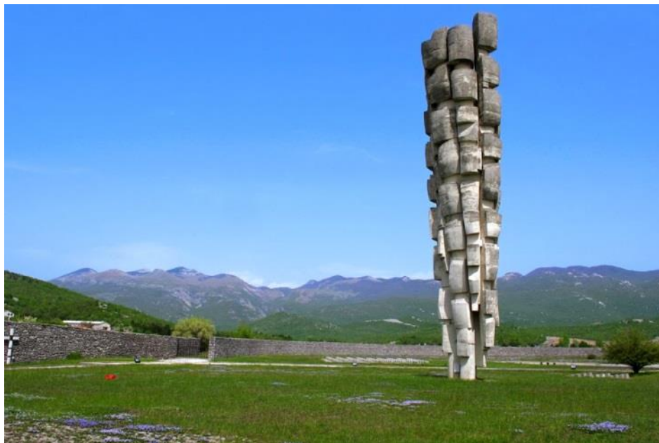
Slika 10: Šime Vulas: Spomenik „Podhumskim žrtvama“, Podhum, (1971.)