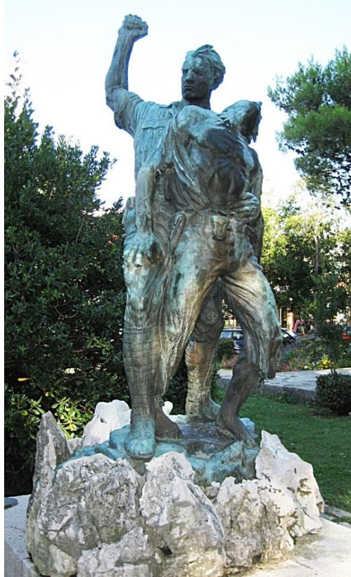
Slika 13: Zvonko Car: Spomenik palim borcima Crikvenica, (1949.)