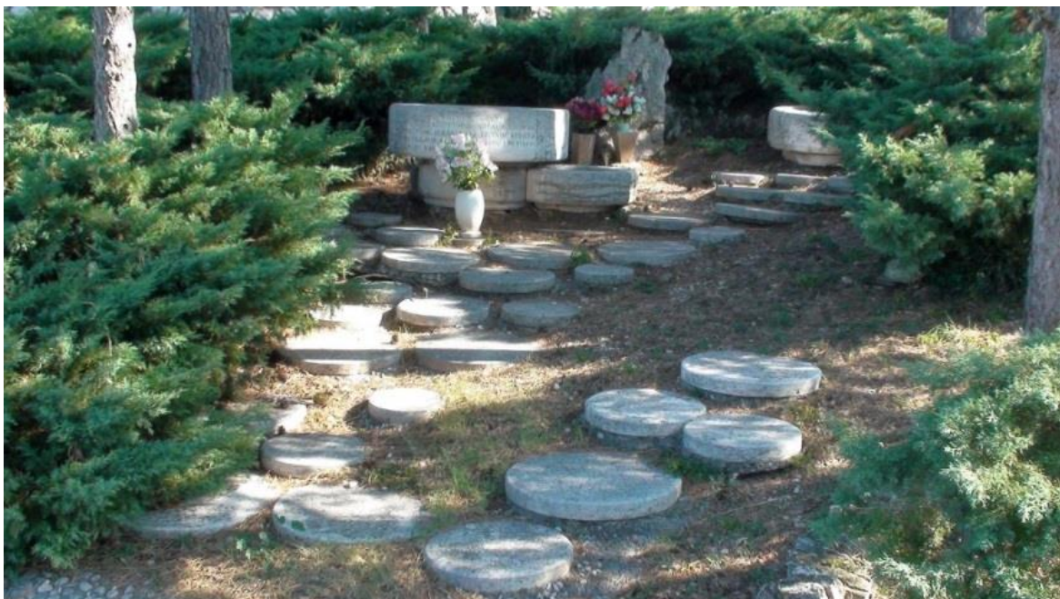
Slika 21: Maša Uravić: Spomen-kosturnica 74 palom borcu, Kraljevica, (1978.)