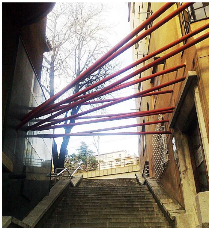
Slika 23: Zvonimir Pliskovac: Spomenik Trinaestorice streljanih, Sušak, (1983.)