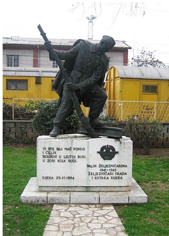
Slika 5: Vinko Matković: Spomenik palim željezničarima, Mlaka, (1954.)

Matkovićev spomenik palim željezničarima podignut je 1954. godine. Prvotni smješten spomenika bio je ispred željezničkog kolodvora, kasnije je premješten pored Kluba željezničara Rijeke. Skulptura željezničara izlivena je u bronci a prikazuje narodnog borca u šinjelu na radnom borbenom zadatku onemogućavanja transporta neprijateljskih vlakova. Matković je spomenik palim željezničarima kao i mnoge izradio vrlo realistično i scenografski. Realističnost izvire iz detalja kao što su šinjeli, čizme i u svakodnevna odjela koja su nosili borci dok su ratovali i radili. 85