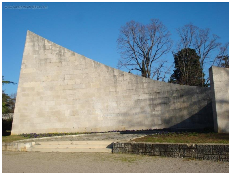
Slika 9: Z. Sila i Z. Kolacio: Spomen-kosturnica palim borcima, Trsat, (1957.)