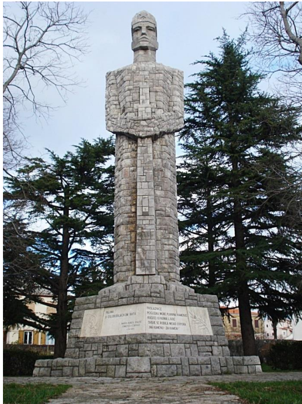
Slika 8: Vinko Matković: Spomenik palim borcima, Rubeši, (1963.)