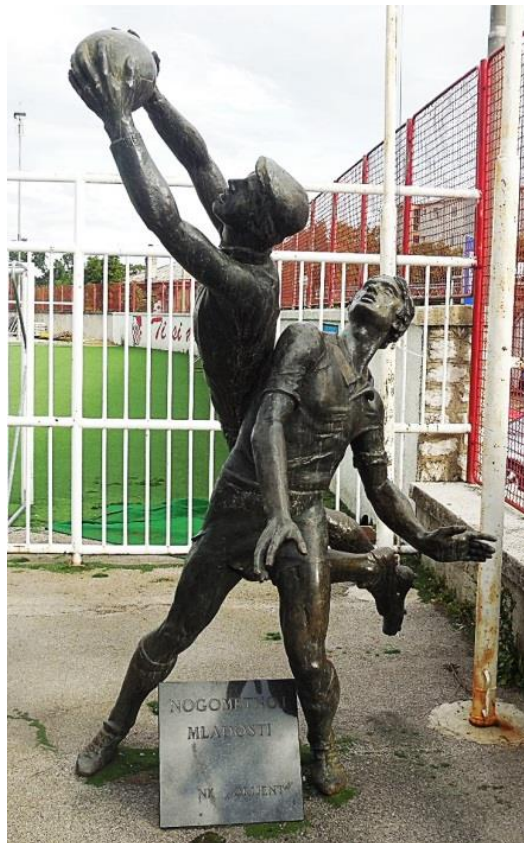
Slika 16: Belizar Bahorić: Spomenik palom nogometašu, Krimeja, (1980.)