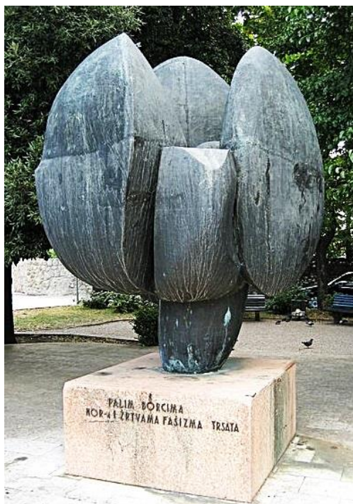
Slika 18: Ljubo de Karina: spomenik palim borcima, Trsat, (1977.)