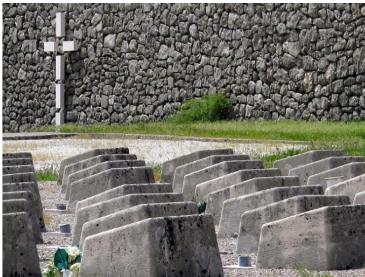
Slika 11: Šime Vulas: Spomenik „Podhumskim žrtvama“, Podhum, (1971.)