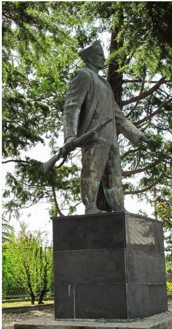
Slika 7: Vinko Matković: Spomenik palim borcima, Čavle, (1962.)