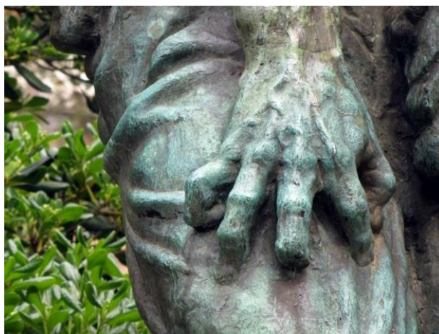
Slika 14: Zvonko Car: Spomenik palim borcima, Crikvenica, detalj, (1949.)