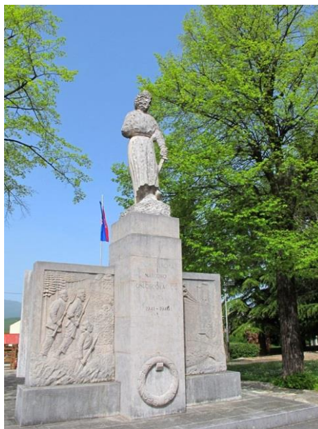
Slika 20: Spomenik palim borcima i žrtvama Viškova, Pehlina i Škurinja, Viškovo, (1950.), poledina spomenika