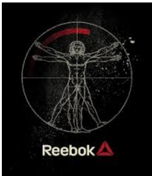
Slika 4 - Reebokov simbol koji se pojavljuje kod učitavanja web stranice