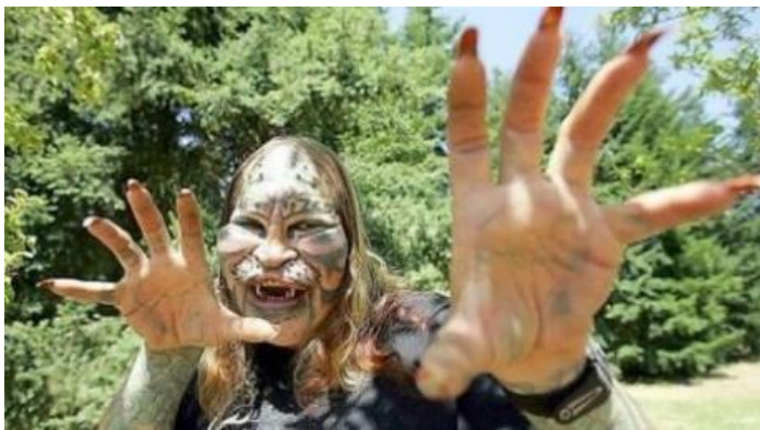
Slika 1 – Dennis Avner – čovjek koji je svoj život posvetio transformaciji u tigra. Avnerova transformacija je uključivala brojne tetovaže, operaciju uši, usna, nosa, umetanje umjetnih brkova, zuba i repa, te operaciju spola.

izgled transformirati prema vlastitim prohtjevima (Primjer: vidi Slika 1 i 2). Mogućnosti tjelesnih transformacija su beskonačne. Estetske operacije svakim danom kao da probijaju granice. Izbrisati bore, ukloniti celulit, smanjiti nos i sve ono što se smatra društveno nepoželjnim i ružnim sada je moguće. Ideal tijela moguće je postići u vrlo kratkom roku, bezbolno i efikasno samo ako uložimo dovoljno novca. No, od povećanja grudi, botoksa i sitnijih korekcija došli smo do faze u kojoj u potpunosti možemo promijeniti svoj fizički izgled – možemo dizajnirati idealnog sebe. S toliko mogućnosti poboljšanja i dizajniranja vlastitog tijela i izgleda, čini se da čovjek u suštini nikada neće biti zadovoljan. Uz korištenje tehnologije kao alata za modifikaciju i poboljšanje ljudskog tijela, društvo naginje i prirodnim resursima i sredstvima. U posljednjih nekoliko godina prisutan je fenomen povratka prirodi koji potrošače potiče da uz pomoć prirodnih preparata i procesa dostignu kult tjelesnosti i vitalnosti. Razvila su se nova tržišta usmjerena na alternativne, bio i prirodne načine prehrane, liječenja i brige o tijelu, a potrošač je opet uvučen u tiraniju izbora između konvencionalne medicine, tehnološke aparature i njenih proizvoda te alternativne medicine koju prate bio i prirodni proizvodi.