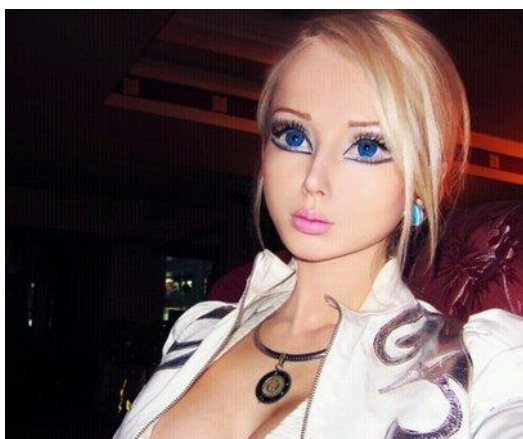
Slika 2 – Ukrajinski model Valeria Lukyanova uz pomoć šminke i plastičnih operacija nalikuje na popularnu dječju lutku Barbie.