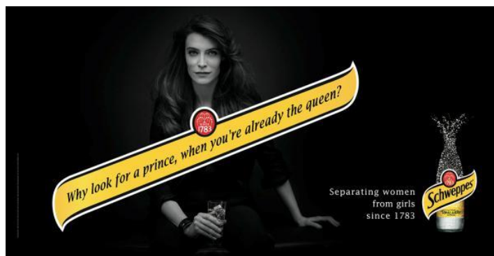
15. Schweppes- „Why look for a prince, when you`re already the queen?“