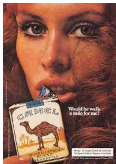
5. „Would he walk a mile for me?“

Ovaj slijed reklama dokazuje kako Camel izričito naglašava „Muškost“ kod muškaraca, tj. on je taj koji muškarca čini muškarcem, do te mjere da bi on prohodao i tisuću milja za jednu kutiju