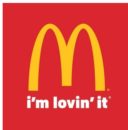
11. „McDonald`s- I`m lovin`it“

Sljedeći se primjer odnosi na jednog od najpoznatijih sportskih brendova-Nike. Već 50 godina, Nike predstavlja simbol sportske kulture i općenito sporta kao načina življenja. Naime, Nike koristi vrlo specifičan način oglašavanja, gdje igrajući emotivnom strategijom i ciljajući na osjećaje prije svega, on koristi i određen arhetip- arhetip Junaka. Kada se Nike obraća gledateljima, on im priča priču kako ništa ne mora biti onako kako je sada, već da može biti bolje, samo ako mi to učinimo, ako nešto promijenimo. Kao što Junak postaje junakom kada pobijedi zlikovca, tako i mi postajemo Junaci kada prevladamo svoju slabost-lijenost. Nike našu lijenost gleda kao zlikovca kojeg smo mi dužni pobijediti, tjerajući nas na promjenu, i motivirajući da pokrenemo sebe i naše tijelo prema cilju. Potpuno inspirativna priča kako od nule možemo učiniti što god želimo, i postati pravi heroj. Pa čak i samo ime brenda, Nike