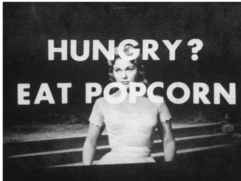
1. „Eat popcorn“

razlikovanja svjesnog i nesvjesnog. Ljudsko oko može vidjeti 24 framea u sekundi, što također ovisi o jasnoći slike i brzini njezinog kretanja, pa se stoga ovaj broj uzima kao prosječni standard. 3 Ono što je nakon tog framea, nalazi se u 25 frameu, koji je ljudskom oku teško „uhvatljiv“, a još teže čitljiv. “Svejedno, 25. okvir se koristi kako bi informacija koju sadrži zaobišla um, i išla direktno u podsvijest. Ova informacija nije viđena od strane osobe, ali je svejedno sačuvana u mozgu, te se pojavi u jednom trenutku kao ideja.“ 4 On nije nevidljiv, samo ga je, zbog slabije rezolucije i kraćeg trajanja, vrlo teško uočiti. Zato on služi kao pravi spremnik subliminalnih poruka. Njegova je upotreba toliko kontradiktorna i upitna, pa je, zbog uspoređivanja sa vrstom hipnoze, u nekim država čak i zabranjen. Studije još uvijek nisu dokazale i utvrdile sve teorije oko ove metode, no vjeruje se da je upravo ovaj djelić reklama zaslužan za prikazivanje skrivenog sadržaja. „Tako je“Eat Popcorn“ ubrzo postala krilatica konzumerizma.“ (Ibid., 270)