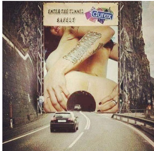
14. Durex- „Enter the Tunnel safely“

Schweppes, osvježavajuće piće, no ne za sve (barem se tako reklamira). Reklame ovog proizvoda iznimno su snažne i dominantne pritom stavljajući veliki naglasak na stvaranje (većinom) pravog muškarca ili prave žene. U reklamama iz 1970-ih, može se vidjeti da Schweppes uvijek igra na sličnu kartu-moći, dominacije, i samouvjerenosti. U reklami koja se nalazi u linku ispod, Schweppes je predstavljen toliko moćno da se njegovo ime niti ne smije izgovoriti, a glavni lik, dok se sve urušava oko nje, osigurava si imunitet i sigurnost pijući upravo Schweppes. Svi likovi koji su predstavljali ovaj proizvod morali su predstavljati jak karakter kako bi uopće mogli predstavljati ovo piće. Schweppes sebe predstavlja u značenju vrlo jakog, britkog i osvježavajućeg pića kojeg ne mogu svi podnijeti. Ovo piće je samo za prave muškarce i žene, one koji odgovaraju opisu njihovog sadržaja. Dakle, reklame su im namijenjene odraslim osobama, najčešće uspješnim i samopouzdanim pojedincima koji znaju što žele u životu, kombinirajući ozbiljnost sa zabavnom uspješnošću koju predstavlja upravo Schweppes. Potpuno izbacujući sve ostale (djecu, tinejdžere, „obične ljude“), Schweppes se fokusira samo na one koji su ga dostojni, te time i omaložava sve one koji „nisu spremni“ okusiti taj pjenušavi napitak. Da bismo bili „dostojni“ piti Schweppes, mi moramo biti kao njegovi glavni akteri, moramo imati određenu osobnost.