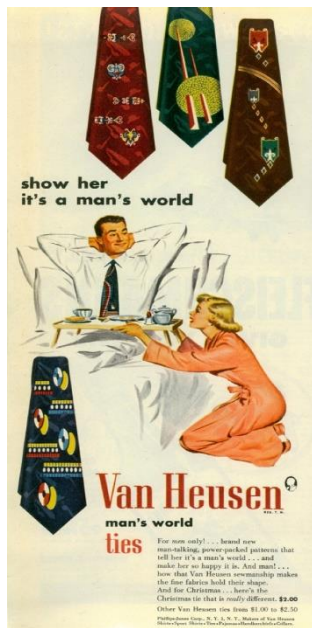
6. „Show her it's a man's world „

Nadalje, istaknut ću modnu tvrtku „Van Husen“, namijenjenu izričito odjeći i modnim dodacima za muškarce.