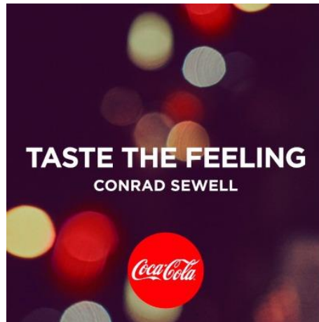
10. „Taste the feeling“

proizvodom. Pravi primjer su božićne Coca-coline reklame, gdje se čak početak božićnog razdoblja uspoređuje s danom kad Coca-cola prvi puta emitira svoju reklamu. Dakle, ukoliko se nađemo u situaciji da nam nedostaje jedan od tih osjećaja ili smo željni iskustva kakva ima Coca-colina priča, posegnut ćemo za pjenušavom bocom i „okusiti taj osjećaj“.