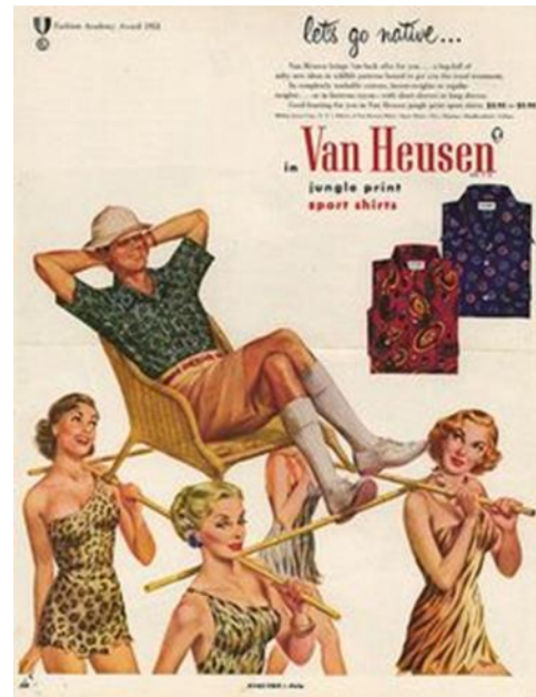
7. „Let's go native“