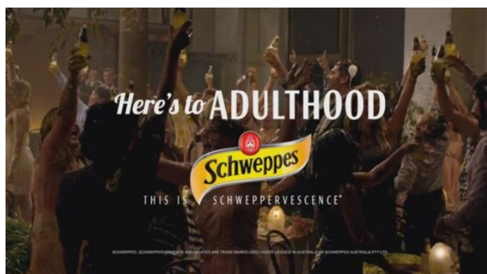
16. Schweppes- „Here`s to Adulthood.“

Kreativnost u oglašavanju ne nedostaje ni kod hrvatskih proizvoda. Kao 1.primjer odabrala sam tradicionalni Kraš koji se na policama nalazi već dugi niz generacija. Jedni od najpoznatijih Krašovih proizvoda su zasigurno Kiki bonboni, koji su svima poznati i prepoznatljivi po krilatici „Bilo kuda-Kiki svuda“. Kraš se poigrao sa jezikom, pritom tvoreći rimu lako pamtljivog zvuka i tona. Ne samo da je već ustaljena na ovim područjima, već i pokazuje kako se Kiki bonboni mogu svugdje kupiti, te da su lako dostupni svima. Kraš je također bio i pionir u povezivanju igara sa svojim proizvodima, pa je tako za čokoladicu „Životinjsko carstvo“ paralelno osmislio i album koji se mora popuniti sa sličicama koje se nalaze upravo u čokoladici. Na taj način, potiče se kupnja jer je popunjavanje albuma, naravno, stimulirano bogatom nagradom paketa svih Kraš proizvoda. Jedna od reklama koja je također plijenila pozornost je ona Krašove Tortice. Dok se Tortica postepeno približavala gledateljima na ekranu iz hipnotizirajućeg kruga, u pozadini se čulo konstantno ponavljanje fraze: „Nemoj misliti na Torticu“ čime se zapravo proizvodio suprotan efekt. Cijela reklama je izgledala poput hipnoze pokušavajući u gledatelju probuditi želju za nečim slatkim, tj. za Torticom. U reklami navodenoj u linku, tu istu hipnotizirajući reklamu gledaju 2 djece koje uz komentar „Koja glupa