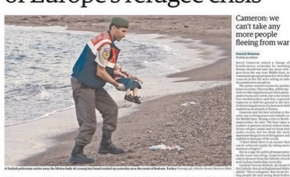
A boy among 12 Syrians who died in boat tragedy.