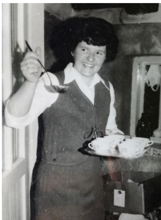
Slika 16: Mlada domaćica