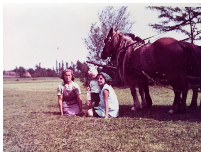
Slika 5: Konji kao prijevozno sredstvo