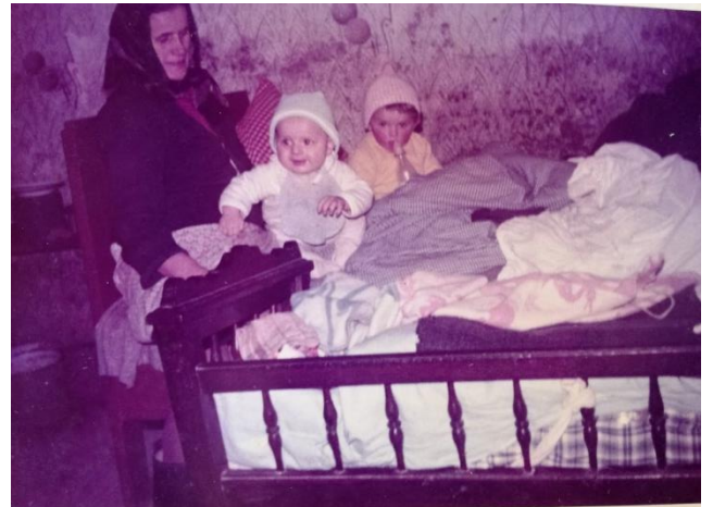
Slika 10: Dječji krevetići – zipke