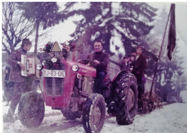
Slika 14: Svadba – svati