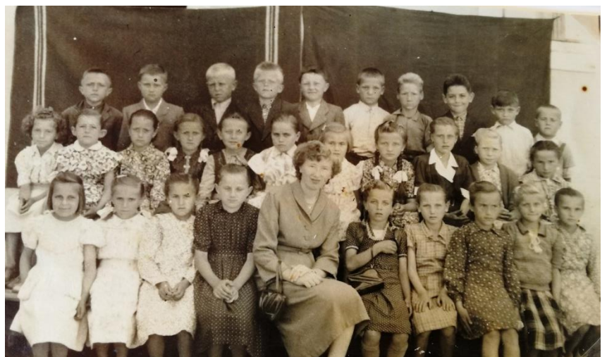
Slika 12: Učenci u osnovnoj školi