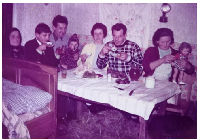
Slika 6: Druženje za božićne dane