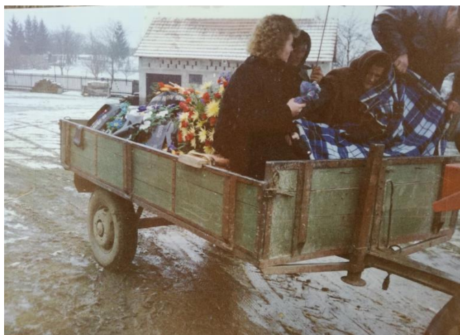
Slika 17: Sprovod