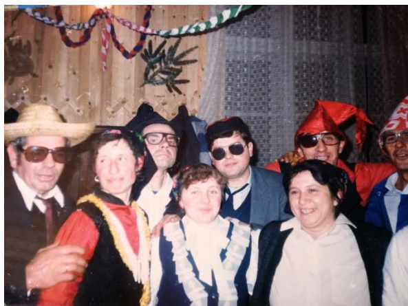
Slika 1: Maškare – mačkare