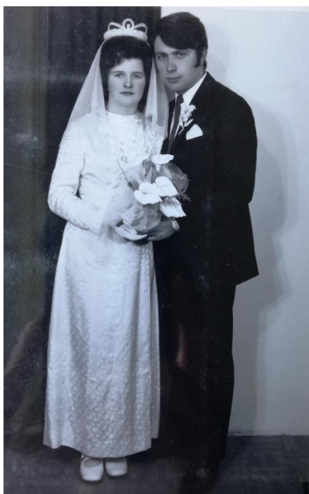
Slika 15: Vjenčanje