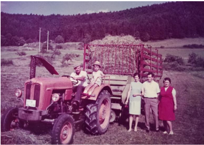
Slika 9: Uvođenje motorizacije