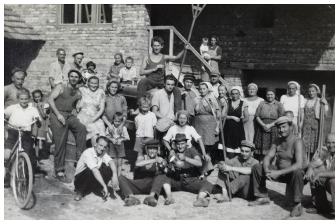
Slika 2: Vršidba – vršenje