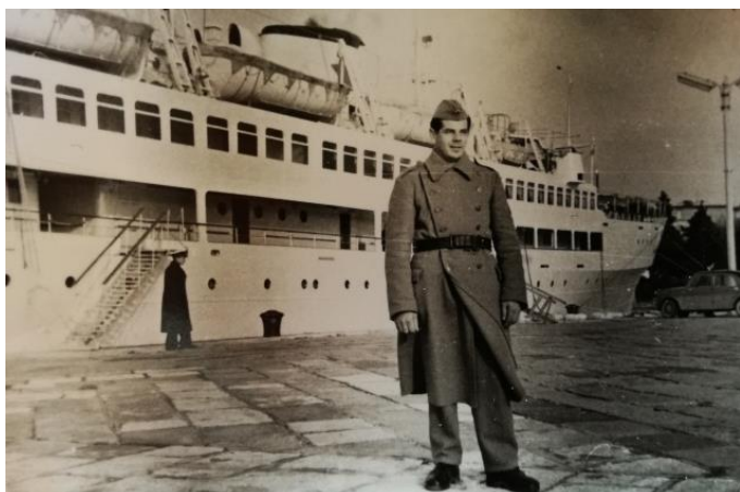
Slika 13: Vojnik