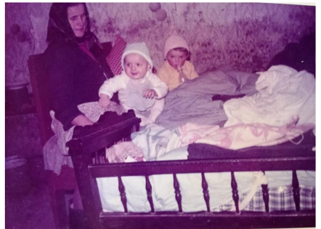
Slika 10: Dječji krevetići – zipke