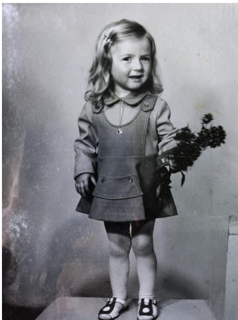
Slika 11: Dijete