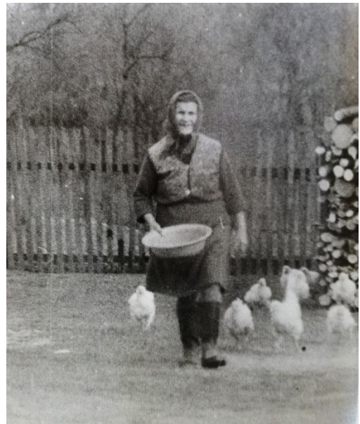
Slika 8: Hranjenje peradi