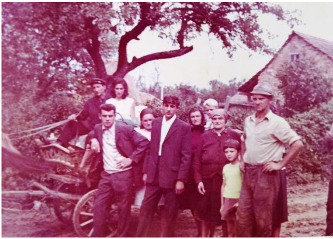
Slika 7: Način odijevanja