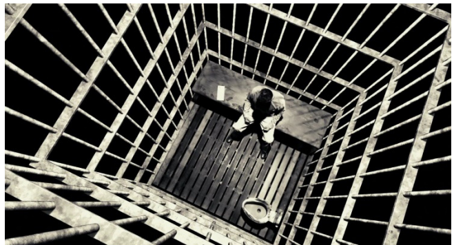
Slika 5. Hartigan sjedi u ćeliji (kadar iz filma)