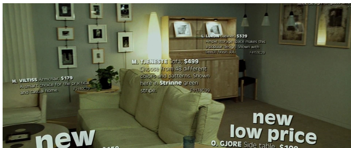
Slika 3. Kadar iz filma Klub boraca koji podsjeća na katalog

filmsku adaptaciju čini više postmodernističkom i eksperimentalnijom od romana. Eksperimentiranje s medijem filma posebno je uočljivo u sceni u kojoj dizajnerski predmeti iz Pripovjedačeva stana ne samo da su prikazani, već je emocionalni efekt koji imaju na publiku još dodatno pojačan tekstovima s imenom, cijenom i opisom proizvoda kako bi podsjećali na katalog (slika 3).