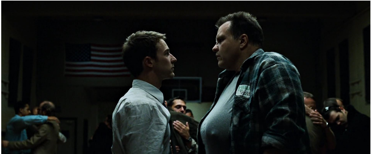
Slika 2. Pripovjedač i Bob u filmu Klub boraca

za njih postati Brad Pitt u nekoj retro košuljici i crvenoj kožnoj jakni, dok će Marla biti Helena Bonham Carter razbarušene crne kose s cigaretom u ruci.