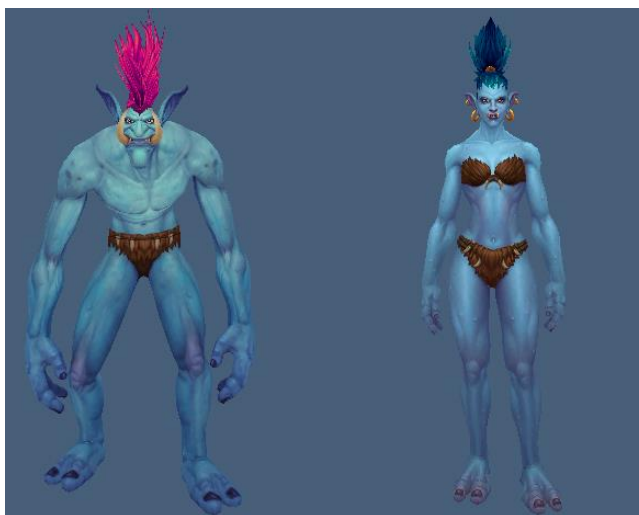
Slika 3. Muški (lijevo) i ženski (desno) troll iz World of Warcraft (preuzeto sa www.mmo-champion.com 16.5.2017. http://www.mmo-champion.com/threads/1762537-Troll-models-in-6-2 )