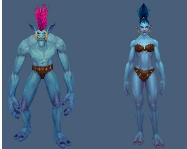
Slika 3. Muški (lijevo) i ženski (desno) troll iz World of Warcraft