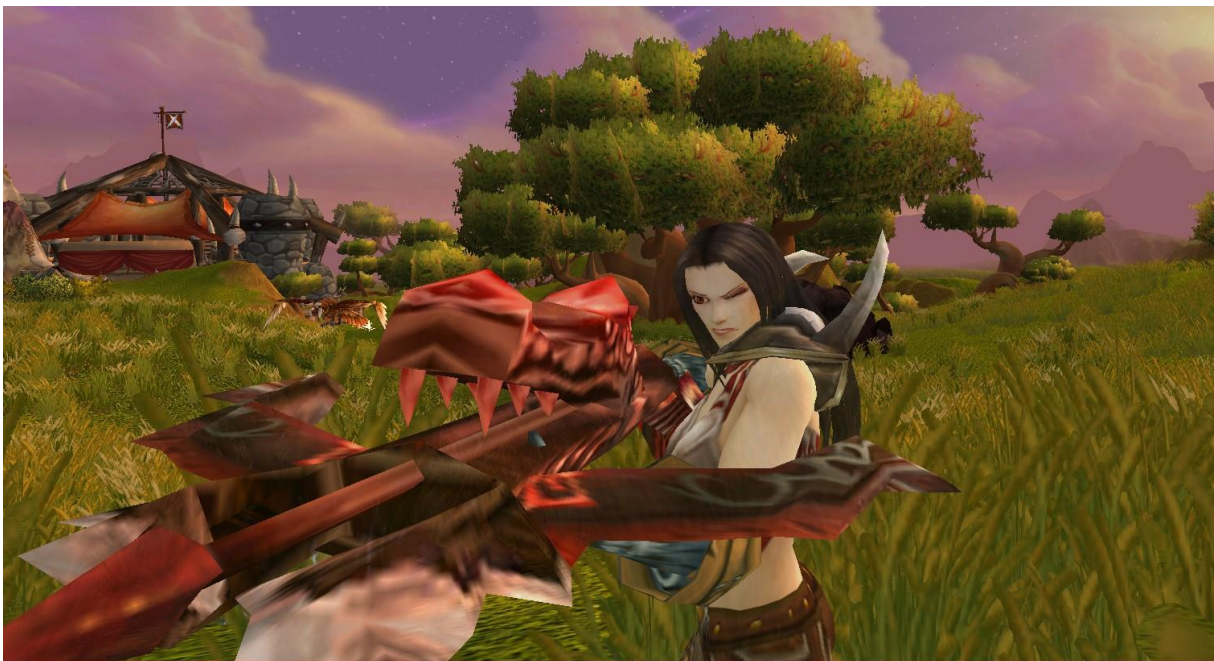
Slika 3. Ženski avatar u borbi