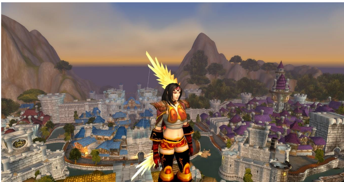
Slika 2. Hiyori, jedna od mojih avatara u World of Warcraftu (rasa: čovjek)