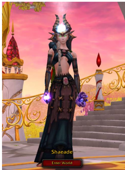
Slika 1. Moj avatar Shaeade (rasa: krvavi vilenjak)

Ono ne označava moga avatara, to nije ime s kojim se identificiram. Foxy sam ja, sama igračica, osoba koja kontrolira avatara. Kada mi se netko obrati sa Foxy, prvenstveno se shvaćam kao osoba igrač, a ne moj avatar. Imam avatara u WoW-u koji se zove Shaeade. Shaeade je priest . Igrajući WoW, nitko me nije zvao Foxy, a WoW tada (prije otprilike 5 ili 6 godina) nije prikazivao ime igrača, samo ime avatara. Tako da se nisam ni imala priliku prikazati kao Foxy, bila sam jednostavno Shaeade. Kad bi me netko zvao tim imenom, podrazumijevao je mene, kao samu igračicu i kao avatara iste. Ukoliko sam napravila novog avatara i dalje razgovarala s drugim igračima koji me poznaju po prvom avatara Shaeade, oni će me najčešće i dalje zvati Shaeade, a novog avatara, kao Shaeadin alt (skraćeno od alternative). Također, ako netko tko me zna kao Shaeade pita tko je to (a misli na mog alta), odgovor će biti Shaeade. Izgleda da nije bitan sam avatar, nego igrač koji ga igra. Identitet tog igrača postaje njegov glavni avatar, dok se s ostalima avatarima identificira. "Online gaming se može sagledati kao aktivnost gdje interakcija s drugima preko digitalne tehnologije nudi priliku da izmjeni nečiji vlastiti identitet izvan tradicionalnih ograničenja." ( J.Rutter, J. Bryce; 2006:177).