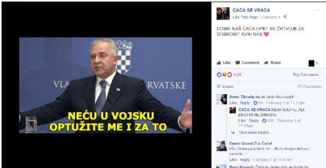
Primjer 5 - ČAČA i vojska