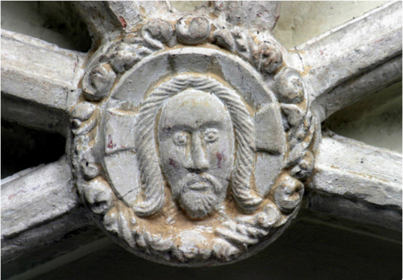
8. Rijeka, kapela Presvetog Trojstva, Vera Icon Rijeka, chapel of the Holy Trinity, Vera Icon