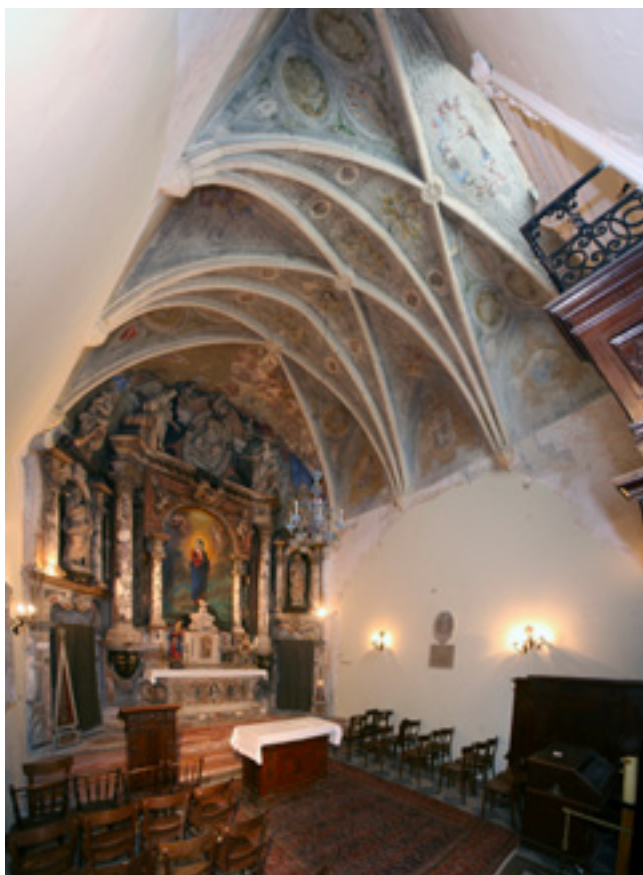
9. Rijeka, kapela Bezgrešnog Začeca Rijeka, chapel of the Immaculate Conception

Rijeka, chapel of the Immaculate Conception, keystone with the coat-of-arms of the Rauber family