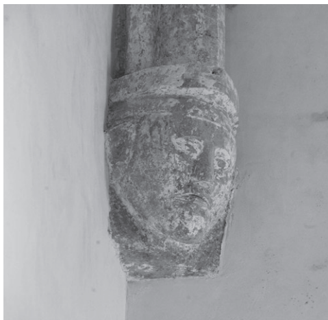
Slika 3: Konzola u svetištu crkve sv. Franje u Krku