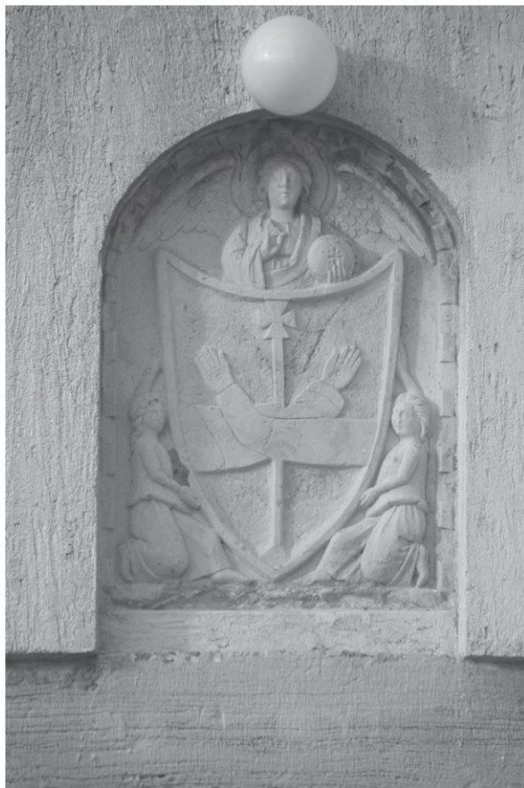
Slika 4: Franjevački grb nad ulazom u samostan sv. Franje u Krku