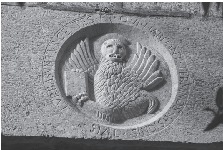
Slika 5: Reljef lava sv. Marka na nadvratniku portala produljenog dijela južnog zida crkve sv. Franje u Krku, snimio D. Krizmanić

Radovi su se zatim mogli nastaviti izvedbom robusnog zvonika oblikovanoga na način karakterističan za lokalne radionice u doba visoke renesanse na otoku Krku. Zvonik raščlanjen kamenim kordonskim vijencima ima jednostavne, danas dijelom zazidane monofore i bifore, ukrašene skromno izvedenom dekorativnom plastikom kapitela s palmetnim listovima i volutama te konzolama u obliku lavljih glavica. Dio toga materijala ondje je sekundarno dospio. Ponešto sličnosti oblikovanja otvora dijeli sa zvonikom omišaljske zborne crkve iz 1536. godine, iako je ondje riječ o još rustičnijoj realizaciji. Dekorativnoj plastici zvonika bliski su reljefi sakristijskog pila crkve sv. Franje, a na radove istih majstora nailazimo i na pročeljima krčkih gradskih kuća.