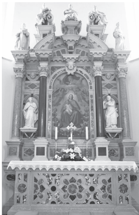
Slika 4: Giuseppe Cavallieri, oltar Gospe od Ružarija, župna crkva svetog Apolinara, Bogovići, 1709.