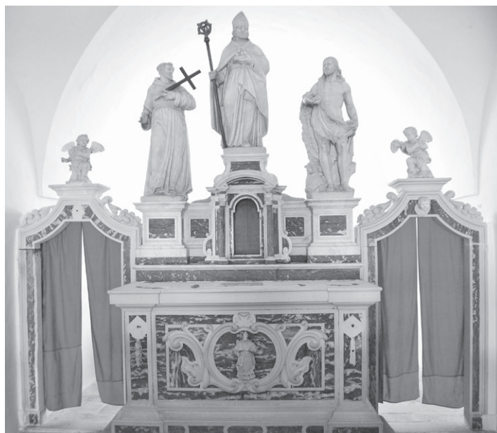
Slika 9: Glavni oltar s kipovima svetog Franje, Nikole i Ivana Krstitelja, crkva svetog Nikole, Porozina, 1747.

slika s prikazom Bogorodice i svetog Antuna Padovanskog iz radionice slikara Baldassarea D'Anne (oko 1572. – 1646.), djelatnog u Veneciji. 30