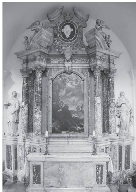
Slika 6: Antonio Michelazzi, oltar svetog Franje Ksaverskog, Katedrala, Senj, 1738.