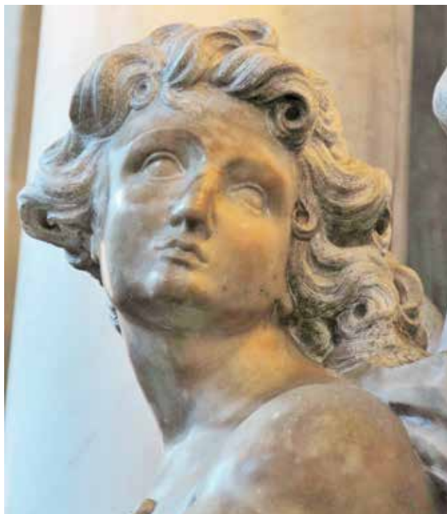
17 Giovanni Comin, Anđeo (detalj), crkva San Marziale, Venecija Giovanni Comin, Angel (detail), church of San Marziale, Venice