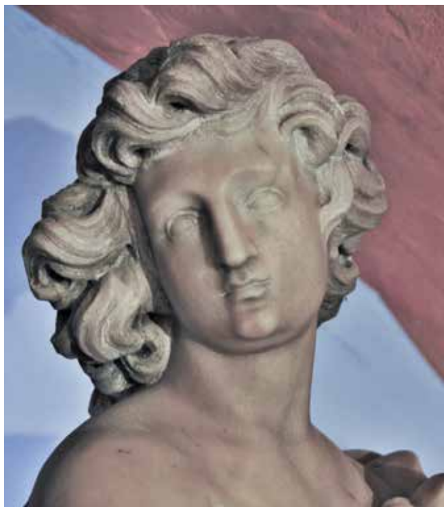
16 Giovanni Comin, Anđeo (detalj), franjevačka crkva na Trsatu Giovanni Comin, Angel (detail), Franciscan church in Trsat