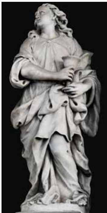
4 Giusto Le Court, Sveti Ivan Evanđelist , crkva Santa Maria della Salute, Venecija

Giusto Le Court , St John the Evangelist, church of Santa Maria della Salute, Venice