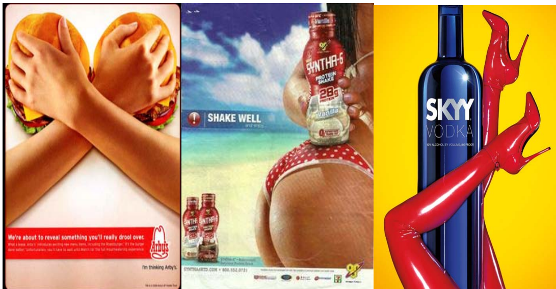
Slike 21., 22., 23. Seksualizirani dijelovi ženskog tijela u reklamama

Također, često s koriste samo pojedini seksualizirani dijelovi ženskog tijela, poput grudi, stražnjice te nogu: