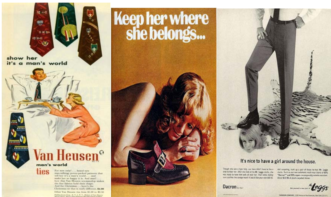
Slike 10., 11., 12. Reklame koje šalju subliminalnu poruku muške dominacije te moći