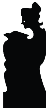
I. B. MAŽURANIĆ