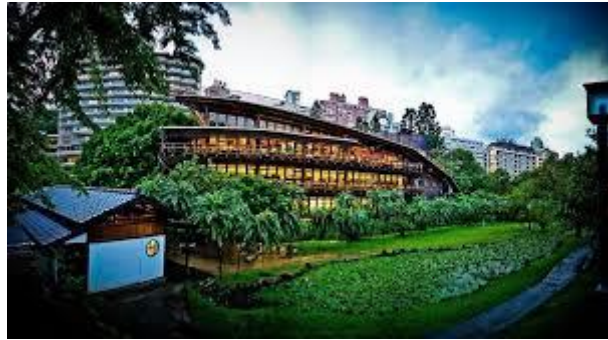
Taipei Public Library's Beitou Branch u Taipeiju