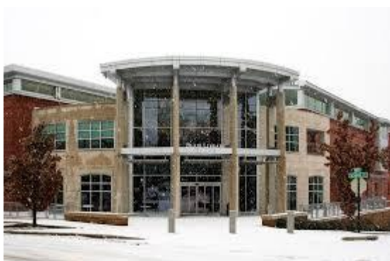
Fayetteville Public Library u Fayettevilleu