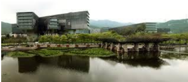
Vanke Center u Shenzenu