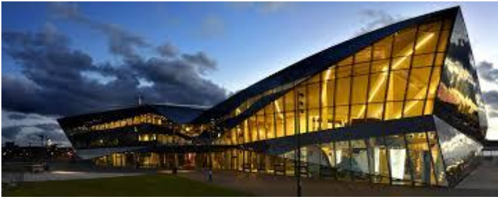
The Crystal u Londonu