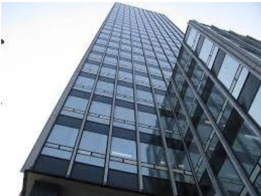
CIS Tower u Manchesteru