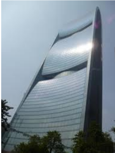
Pearl River Tower u Guangzhouu