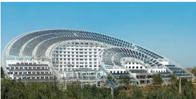
Micro Emission Sun-Moon Mansion u Dezgouu