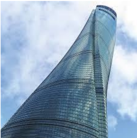
Shangai Tower u Šangaju