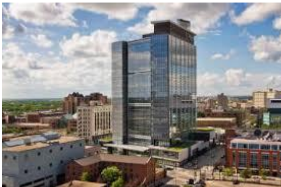
Manitoba Hydro place u Winnipegu