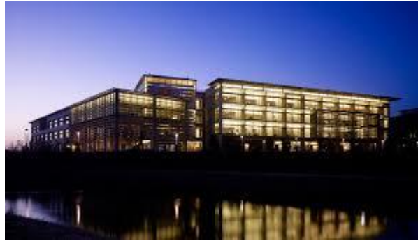
University of California, Kolligian Library u Mercedu