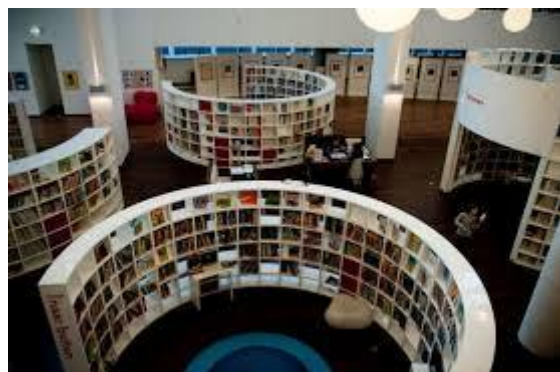
Narodna knjižnica u Amsterdamu