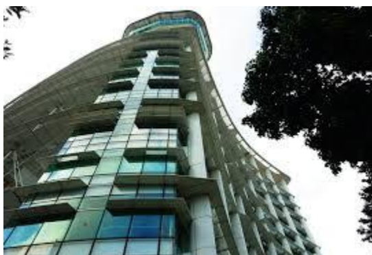
Nacionalna knjižnica Singapura u Singapuru