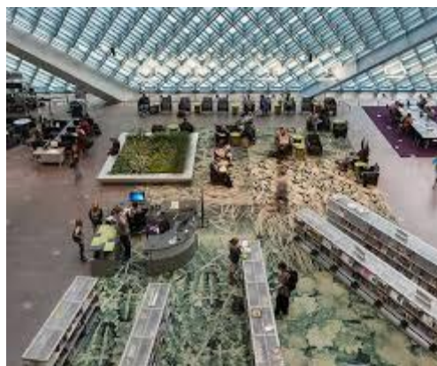
Seattle Central Library u Seattleu