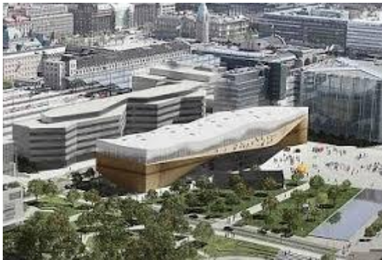
Središnja knjižnica Helsinki u Helsinkiju