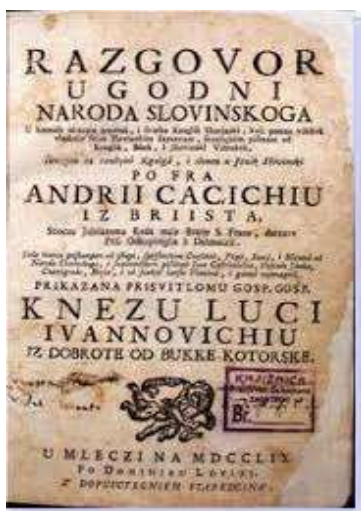
Slika 2 Razgovor ugodni naroda slovinskoga (1756. - 1759. godine)

Izvor: https://www.goodreads.com/book/show/16128552-razgovor-ugodni-naroda-slovinskoga , pregledano 2. kolovoz 2018