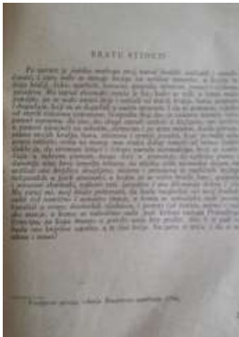
Slika 1. Predgovor prvog izdanja (1756.) Slika 5. Predgovor drugog izdanja (1759.)