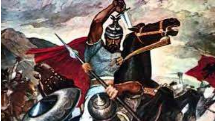
Slika 6. Jure Kastriotić- Skendrebeg ( 1443.-1468.)

Izvor: http://shqiperia.njekomb.com/23461/ , pregledano 3. kolovoz 2018