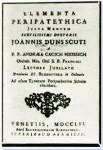
Slika 1 Elementa peripatethica iz 1752. godine