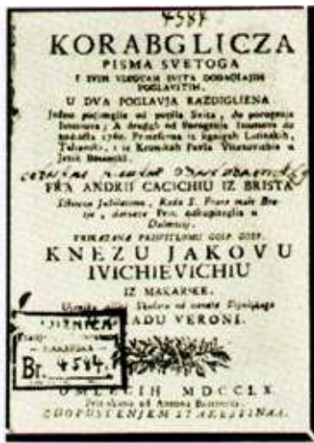
Slika 3 Korabljica iz 1760. godine