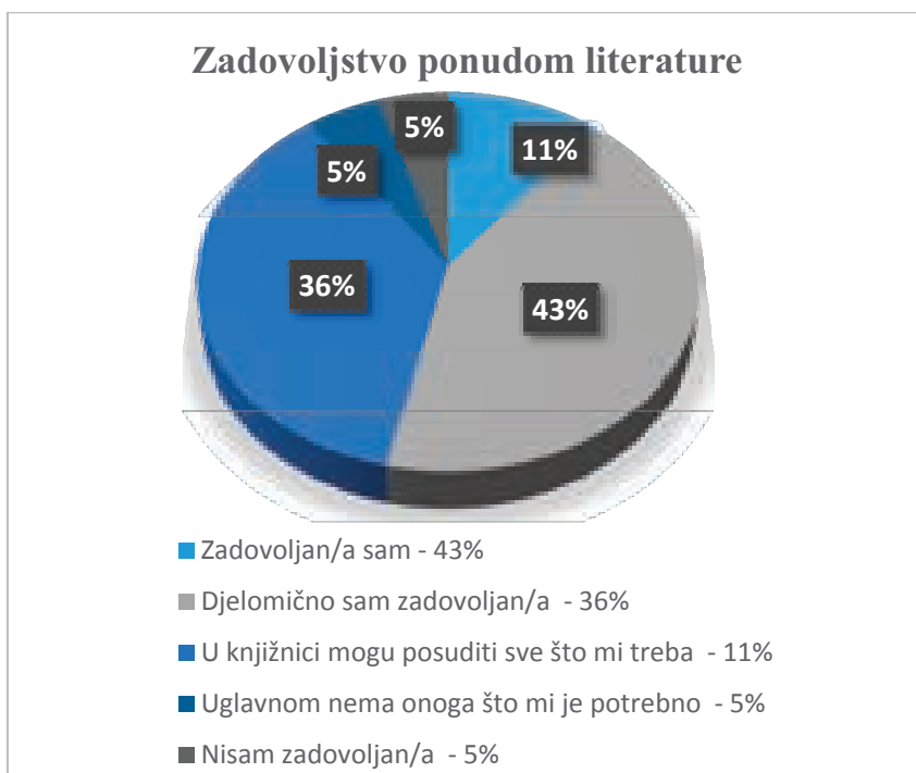
Slika 2. Zadovoljstvo ponudom literature

„Premali broj primjeraka knjiga. Često za literaturu koja mi je potrebna postoje samo jedan, dva ili tri primjerka koja su rijetko dostupna.“