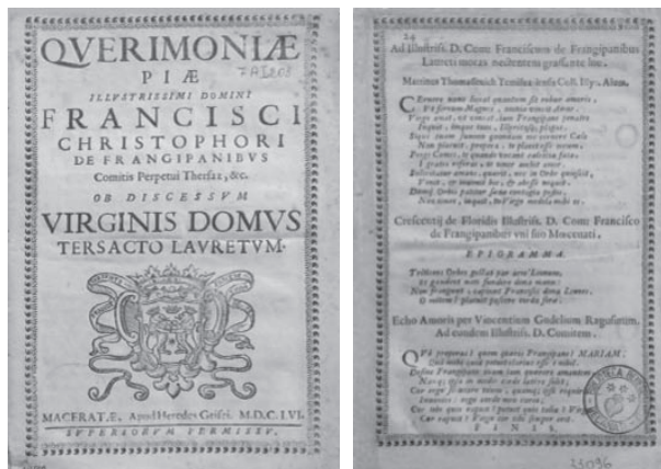
Sl. 2. Primjerak Frankopanova prvotiska (Macerata, 1656) pod naslovom Querimoniae piae illustrissimi domini Francisci Christophori de Frangipanibus Comitis Perpetui Thersaz, &c. Ob discessum Virginis Domus Tersacto Lauretum te posljednja stranica s oznakom FINIS i pečatom knjižnice. Biblioteca diocesana p. C. Benedettucci [sign.: coll. 7 A I 203], Recanati, Italija

Djelo Querimoniae piae illustrissimi domini Francisci Christophori de Frangipanibus Comitis Perpetui Thersaz, &c. Ob discessum Virginis Domus Tersacto Lauretum tiskano je za Frankopanova života, te ga je vrlo vjerojatno sam autor i priredio za tisak. Riječ je o drvoreznoj knjizi koja je uvezana u sveščić nalik brošuri, a na što upućuje ornamentalni drvorezni okvir koji uokviruje tekst na svakoj od 24 stranice. Na naslovnici se nalazi grb obitelji Frankopan, pa je moguće pretpostaviti da je autor snosio troškove objavljivanja djela. Tome u prilog ide i jedan u mlađem izdanju ispušten epigram pod naslovom Crescentij de Floridis Illustriss. D. Com: Francisco de Frangipanibus uni suo Moecenati . Ispod naslovnoga grba navedeno je mjesto i godina tiskanja te tiskara: Apud Heredes Grisei .