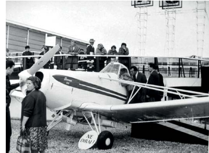
Prilog 4: Vojni zrakoplov za prskanje usjeva tvrtke Piper Aircraft Corporation na izložbi Intensive Farming 1964. na Zagrebačkom velesajmu.