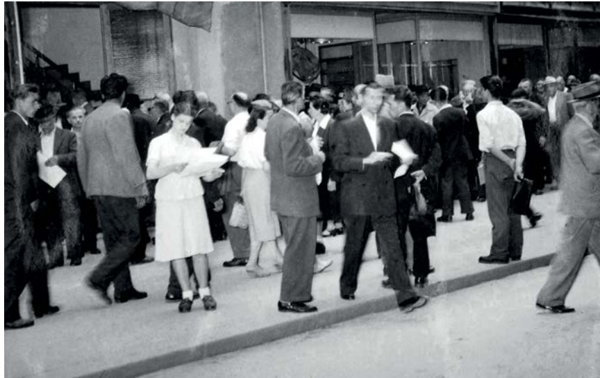
Prilog 1: Redovi ispred Američke čitaonice u Zagrebu na podjeli dnevnih radionovina Bilten ( Izvor: SAD – NACP – RG 59 – CDF 1950-1954, kut. 2472, fasc. 511.68/7-353, „Enclosure 3 in despatch 4 from the American Consulate Zagreb to the Department of State“, 3. srpnja 1953.)