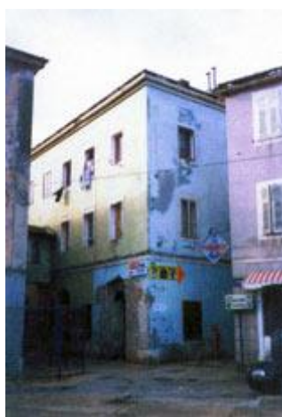
Slika 2.: Zgrada prve Hrvatske čitaonice (desno krilo stare Pomorske škole u Malom Lošinjju) 72